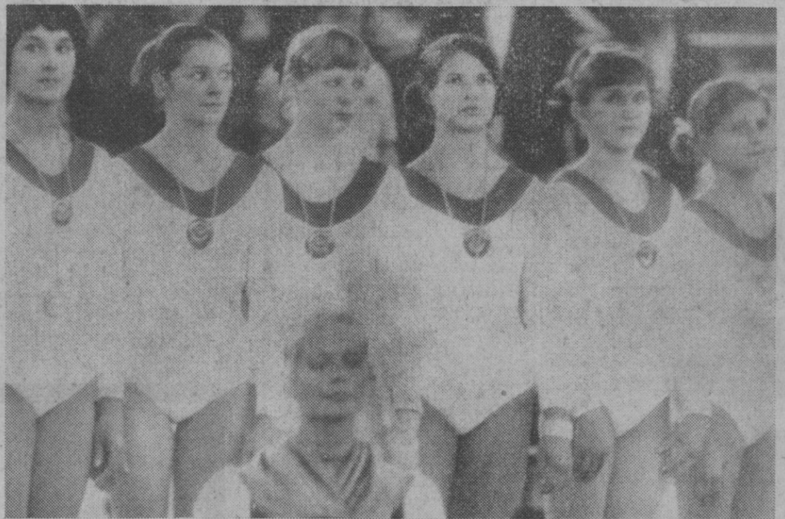
Munich.—El equipo de gimnastas femenino de la Unión Soviética durante la ceremonia de imposición de las medallas de oro. La medalla de plata fue ganada por Alemania Oriental, y la de bronce por Hungría.

Valencia, 29.—Un hombre que cayó desmayado en la plaza de la Virgen, de esta ciudad, tuvo que ser atendido, en primera instancia, por el ministro de la Vivienda, Vicente Mortes Alfonso, que en esos momentos pasaba por aquel lugar. El señor Mortes detuvo el coche y prestó los primeros auxilios. En seguida acudió un coche de la