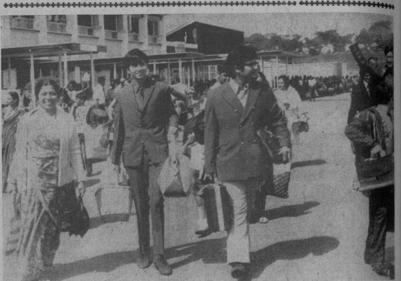
Kampala.—Algunos de los 60.000 asiáticos con pasaporte británico que deben abandonar Uganda se disponen a abordar los aviones fletados por compañías inglesas que les conducirán a Londres.

El príncipe Guillermo de Gloucester, primo de la reina Isabel de In-