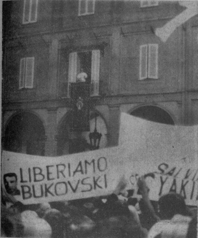
Desde la ventana de su estudio S. S. el Papa observa la manifestación del «Movimiento Europa Civilta», organización católica de derechas que piden en sus pancartas la liberación de Bukovski y de Yakiro. Entre los peregrinos que asistían a la bendición figuraba un grupo de ucranianos de Canadá.

También inserta el periódico oficial otras disposiciones del mismo Departamento por la que se dispensa de la vuelta al territorio español para recobrar la nacionalidad española a diversas personas.