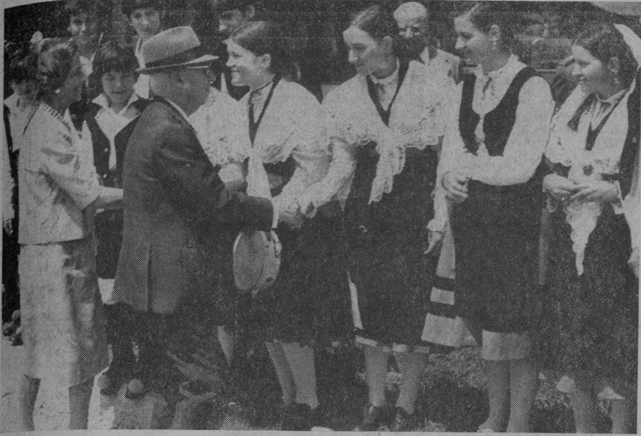
La Coruña.—Acompañado de su esposa, doña Carmen Polo de Franco, el Jefe del Estado llegó a su residencia veraniega del Pazo de Meirás. Después de ser duntipimentado por las autoridades, Su Excelencia saludó a los miembros de la agrupación folklórica Anturuxo que interpretó diversas composiciones gallegas.