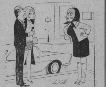
—Una brutal crisis de amnesia, Berta, no me acordaba que estaba casado.

¡¡VISTA GRATIS!! con cheques-compra Quintanilla