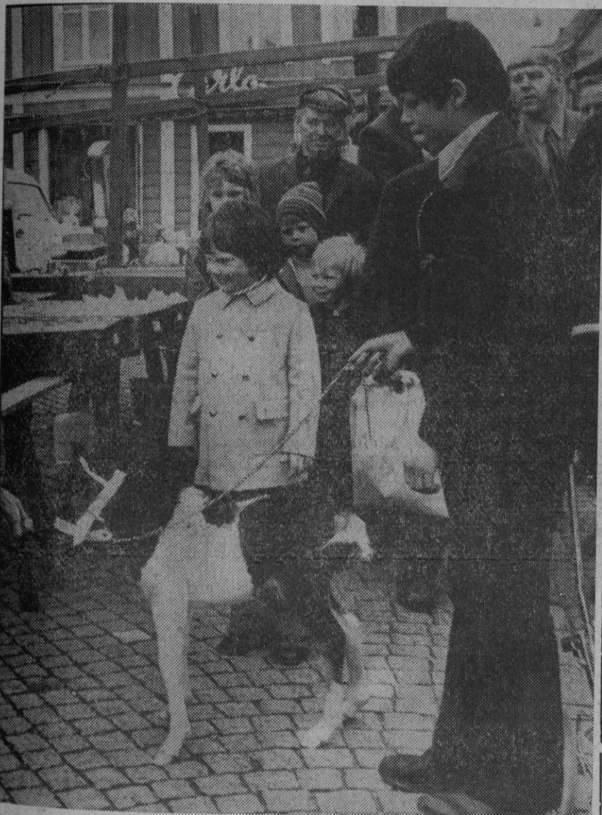
Este es Linette, un minicaballo que pesó 10 kilos al nacer, en Suecia, y que no llegará a medir más de un metro de altura. Perteneció a la raza de los Ponies Shetland. Son animales muy pequeños, pero muy trabajadores y, sobre todo, son la delicia de los pequeños.

El artículo de «Les Echos» está firmado por Georges Elgozy y aparece en la página de editoriales y destacado en un recuadro.—Efe.