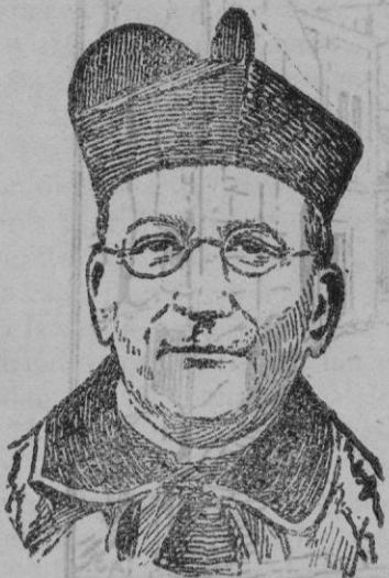
El Cardenal Monsenor Lepicier, que ha sido nombrado Legado Pontificio "a latere" en el Congreso Eucaristico Internacional de Cartago.

lor y tristeza, que experimenta al verse abandonado hasta de su propio Padre.