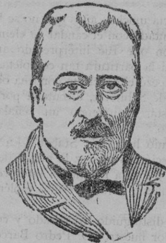
Eckener, comandante del "Graff Zeppelin", que lleg6 ayer a Sevilla.