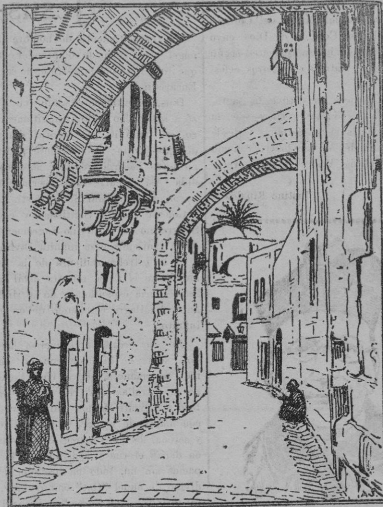
Jerusalén. — Tarik es-Serni (Via Dolorosa. — (Dibujo de A. Jiménez).