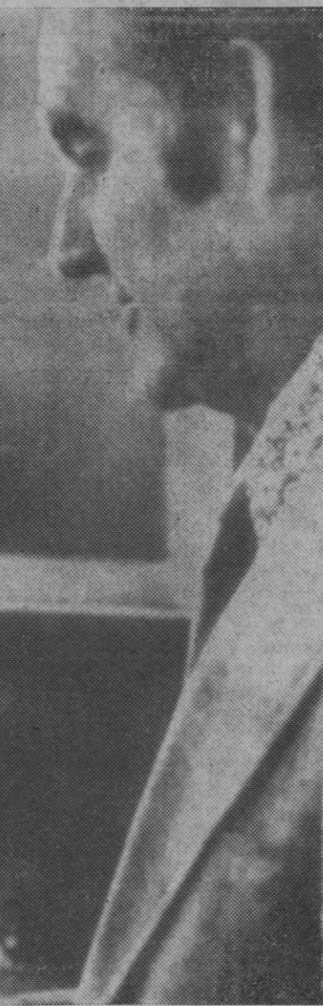
Miami Beach.—El senador McGovern observa por televisión a su directo rival, el senador Humphrey, cuando éste anunciaba la retirada de su candidatura en la Convención Demócrata Nacional de Miami Beach.