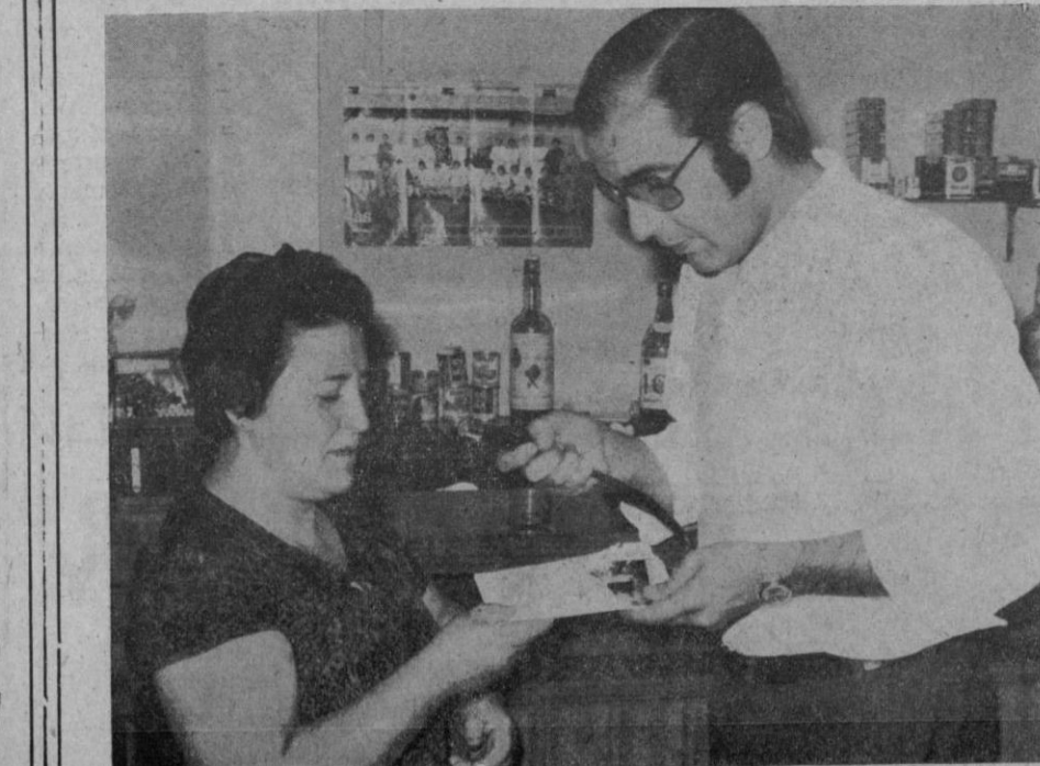
Este premio (segundo del sorteo del pasado 10 de junio) se fue a