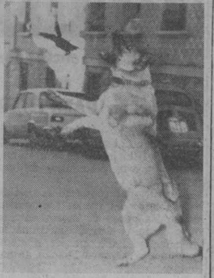
En la calle, ambas amigas se entretienen en sus juegos.