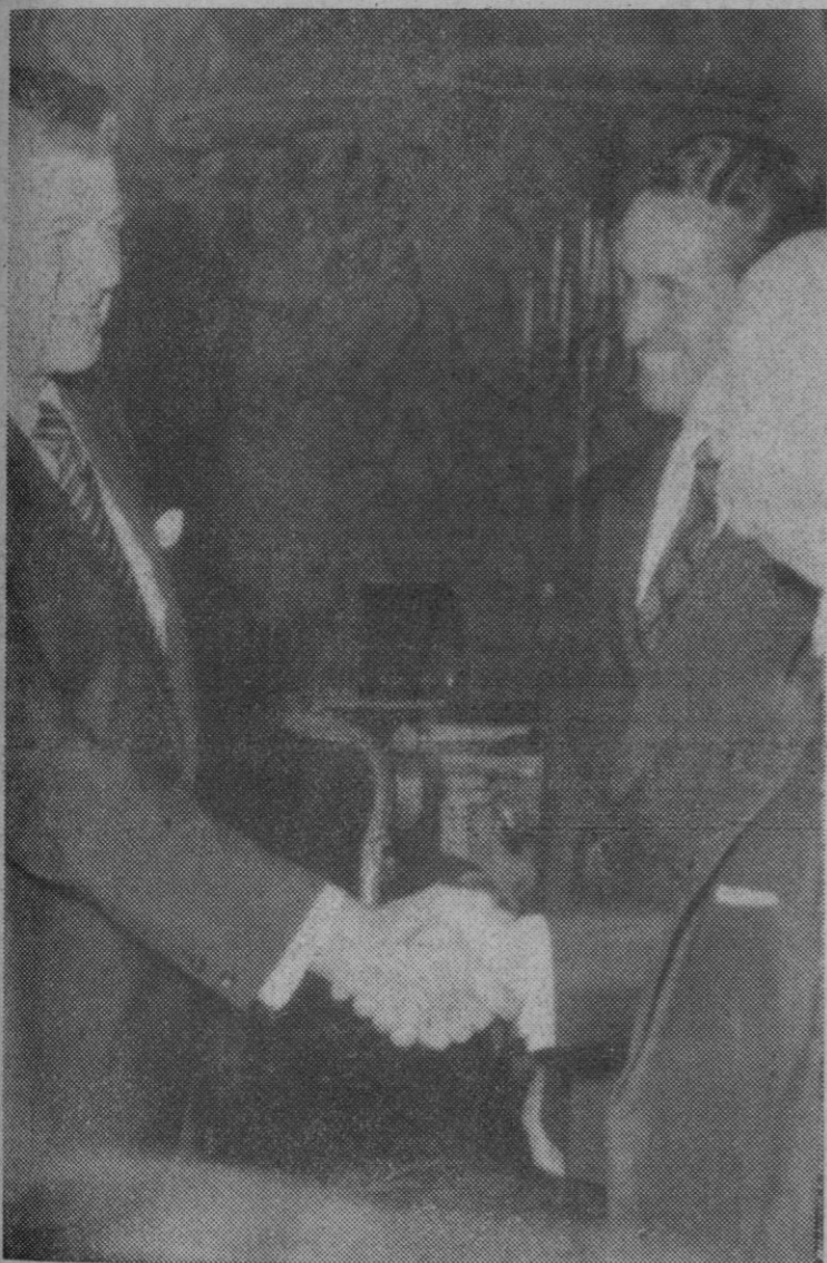
Madrid.—Ronald Reagan, gobernador de California y enviado del presidente Nixon a varios países europeos, durante su audiencia con el jefe del Estado español, Generalísimo Franco, en el palacio de El Pardo.—(Foto Europa Press)

En el edificio del banco de pruebas le fue ofrecida al Príncipe una copa de vino español. Más tarde el Príncipe, los ministros, el consejo de administración de «Iberia» y los directores de los periódicos y agencias nacionales se reunieron en una comida en las salas de la exposición «Iberia 72». Después del almuerzo el Príncipe regresó en helicóptero al palacio de la Zarzuela.—Cifra.