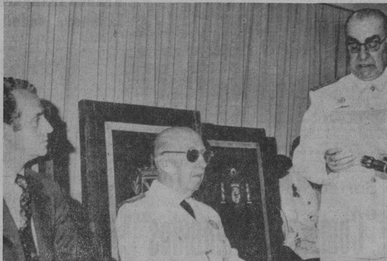
El Jefe del Estado, a quien acompañaban el Príncipe de España, vicepresidente del Gobierno, ministros y otras autoridades, inauguró ayer el nuevo edificio del Instituto Nacional de Estadística, situado en la avenida del Generalísimo. En la foto, la presidencia del acto durante las palabras pronunciadas por el almirante don Luis Carrero Blanco

El Jefe del Estado recorrió varias de sus instalaciones y presidió un acto en el salón de sesiones