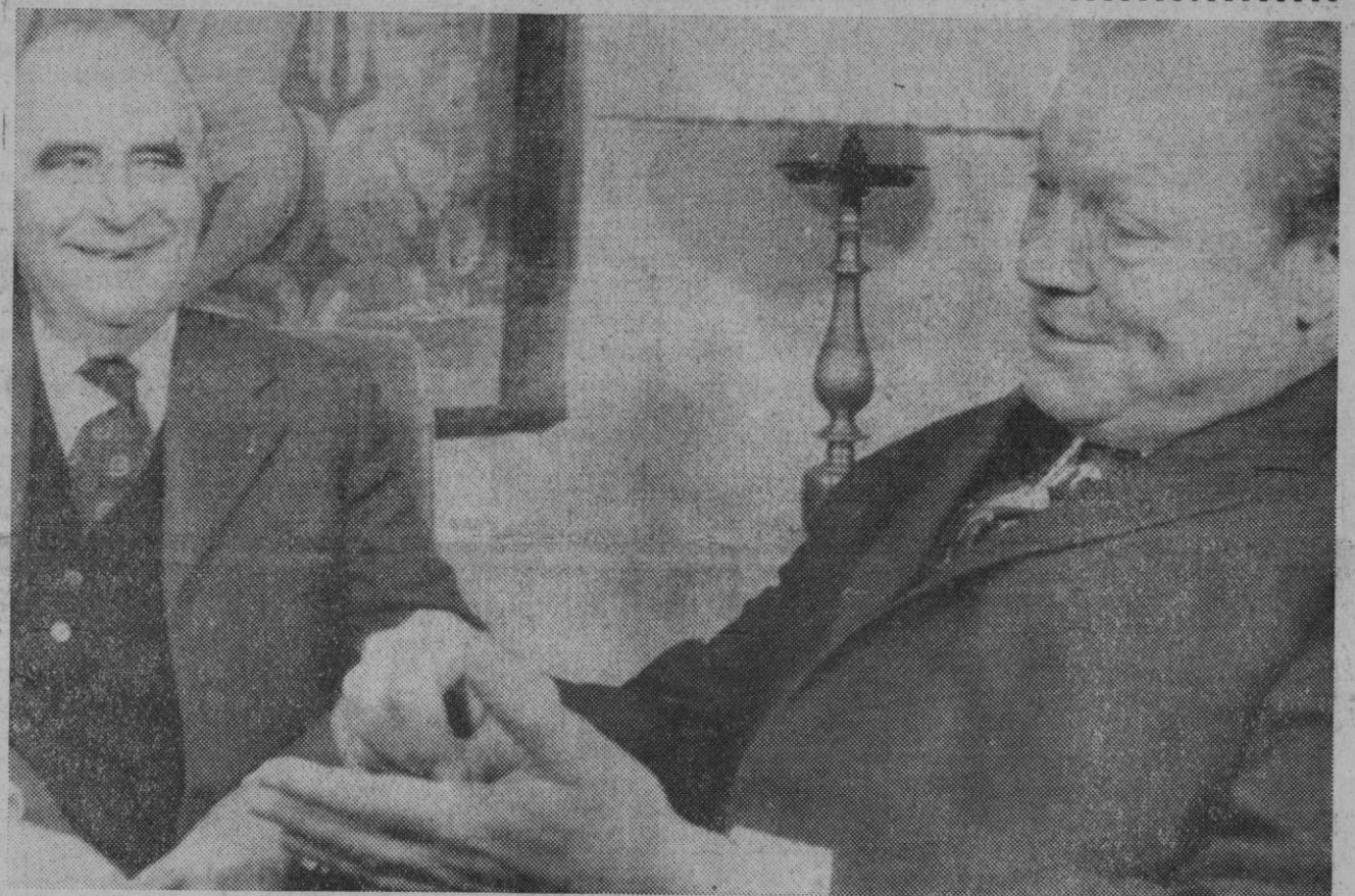
Bonn.—De acuerdo con el programa de consultas semestrales entre Francia y Alemania, el presidente Pompidou ha llegado a Bonn, donde fue recibido por el canciller federal Willy Brandt.

quen las directrices y orientaciones que han de guiar a la Comisión en un futuro. A tal fin, y para marcar las actividades que el Secretariado Nacional del Clero tendrá que desarrollar en adelante, los obispos recibirán en el transcurso de la reunión a dos miembros de dicho Secretariado.