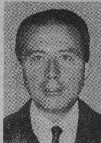
Giulio Andreotti, que ha formado el nuevo Gobierno italiano de centro-derecha