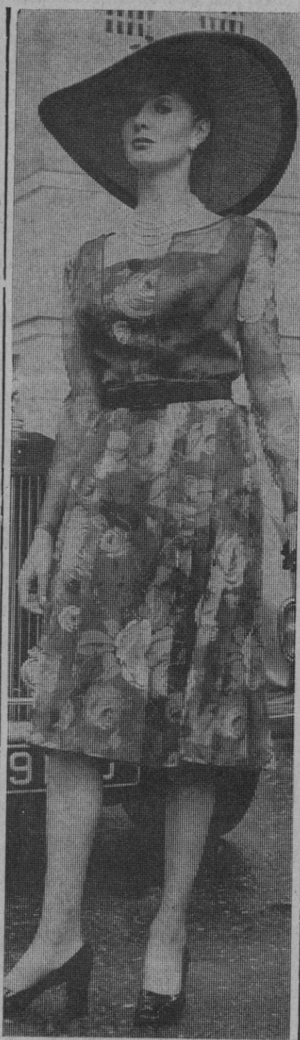
«Grand Prix» es el nombre de este traje de calle que Lachasse acaba de presentar para la temporada primavera-verano.