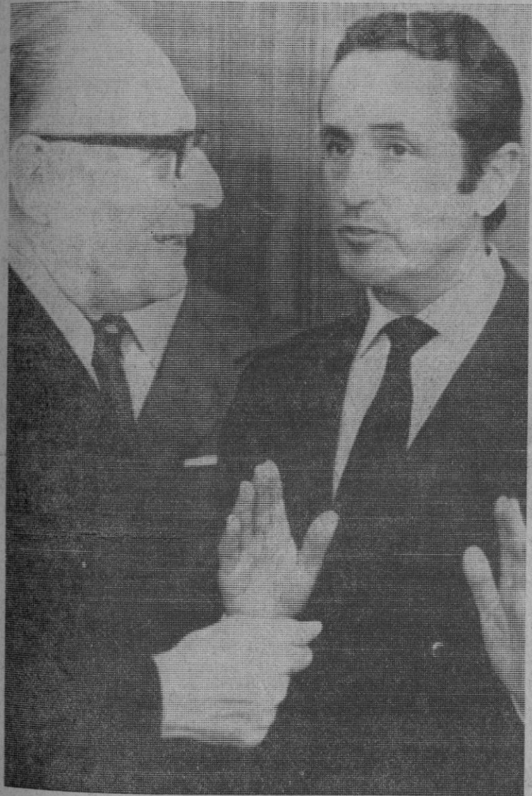
París.—El ministro de Asuntos Exteriores español, don Gregorio López Bravo, conversa con su colega francés, Maurice Schumann, antes de la apertura de la sesión a nivel ministerial de la O. C. D. E.