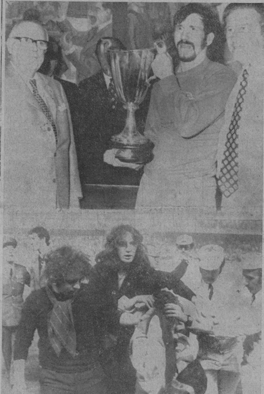
Barcelona.—Arriba, el capitán del equipo escocés recibe la copa como ganadores del torneo. Abajo, un incidente entre los seguidores del Rangers.

Nixon vigila su peso en la Casa Blanca mediante almuerzos espartanos diarios a base de queso de granja. Y en cada uno de sus viajes ha conservado según se sabe, este régimen dietético.—Efe-Upi.