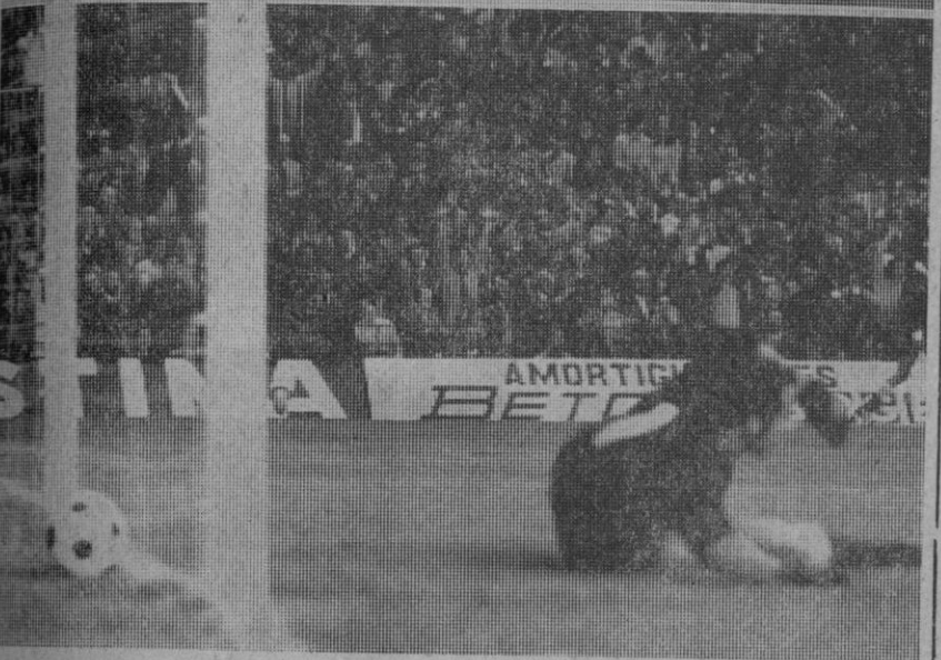
Madrid.—El Caudillo recibe de manos de don Vicente Calderón una placa conmemorativa de la inauguración oficial del estadio. Abajo, el primer gol de España conseguido en el Vicente Calderón, contra la selección uruguaya. El gol fue obra de Valdez.