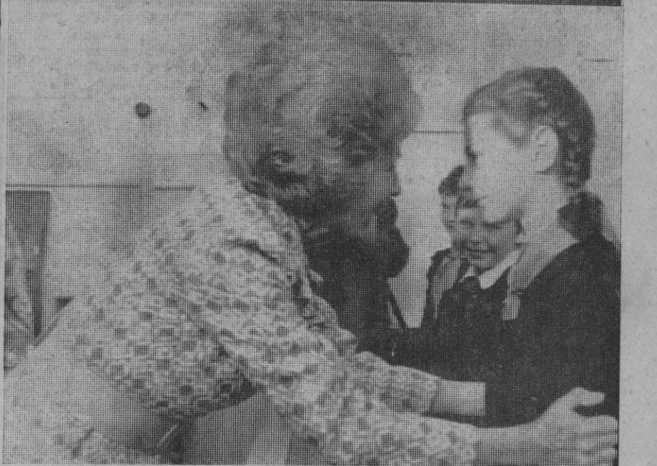
Moscú.—El presidente Nixon, con una copa en la mano conversando con el presidente Podgorny. Abajo, la señora Nixon con un escolar soviético de enseñanza secundaria.