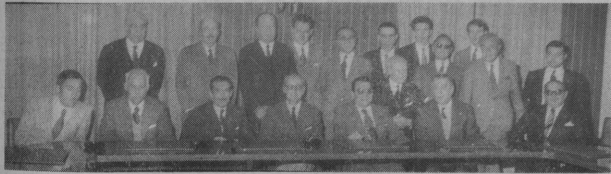
Los miembros del Tribunal Sindical de Amparo fotografiados con las primeras autoridades provinciales

Presidió el gobernador civil, acompañado del fiscal de la Audiencia, presidente de la Diputación, alcalde de Segovia, nuevo delegado sindical