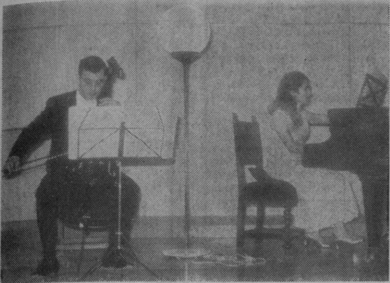
Los intérpretes, durante el concierto de anoche.

bert, una de las más inspiradas melódicamente del compositor austriaco, transmitió su extraordinario lirismo y su encantadora belleza al auditorio, verdaderamente extraordinario, a través de una interpretación correcta y ajustada, llena de respeto hacia la partitura. La Sonata en mi menor, de Johan-