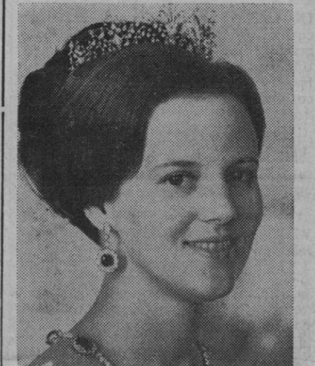
La Reina Margarita II de Dinamarca, nueva soberana del país tras el fallecimiento de su padre el Rey Dederico IX.

ma de la paz en Indochina para sus maniobras electorales y de haber lanzado la nueva «bomba» diplomática porque sabe que perderá la guerra si no se pone fin a las hostilidades. Efe-Reuter.