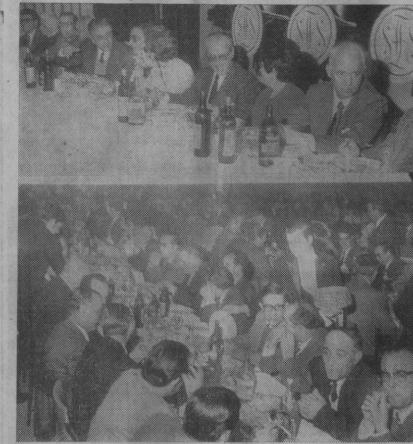
Arriba, un aspecto de la presidencia del homenaje, y abajo, una parte de los numerosos comensales que se sumaron a él.