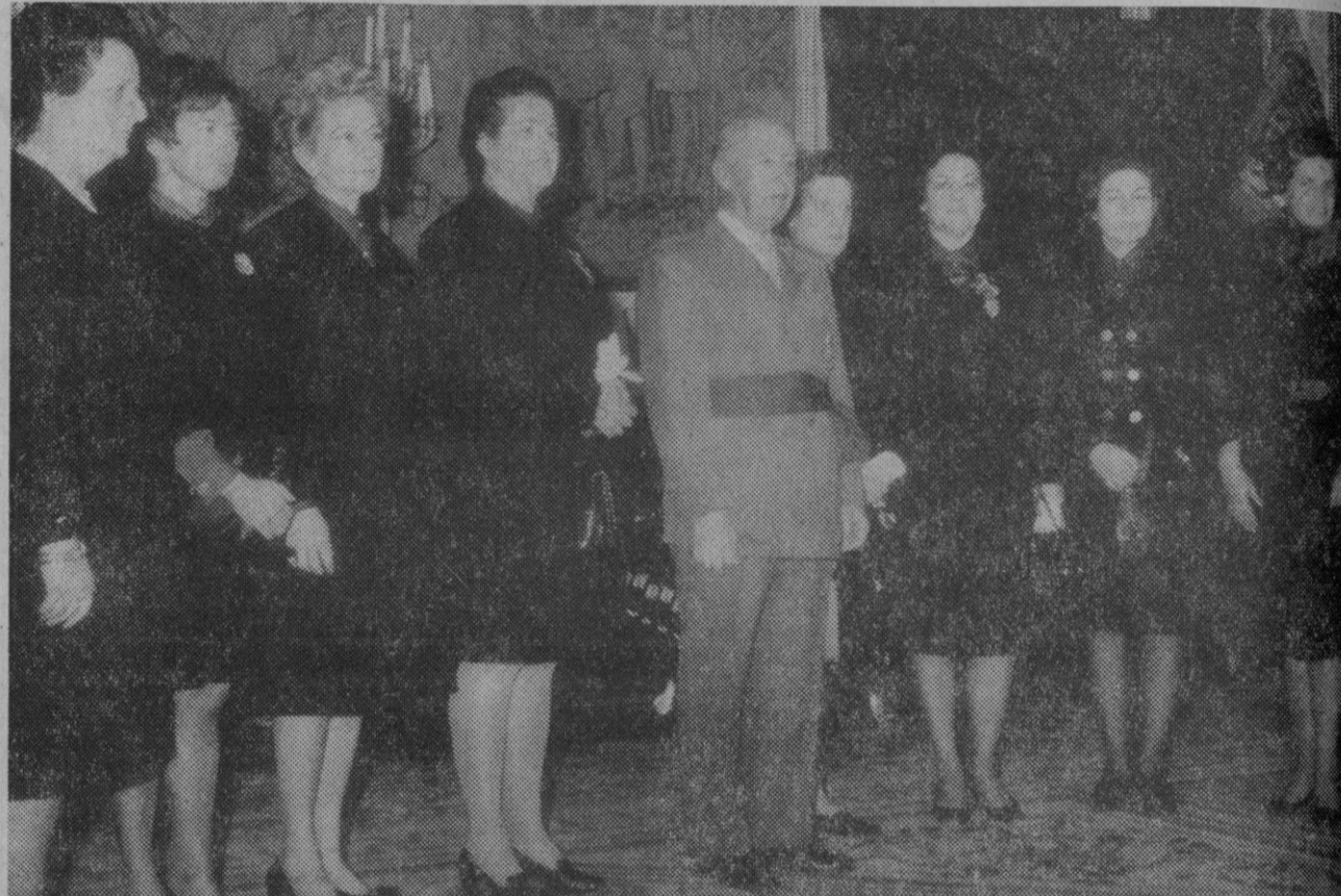
Madrid.—Su Excelencia el Jefe del Estado, Generalísimo Franco, ha recibido en audiencia a las procuradoras del Cortes femeninas, acompañadas de doña Pilar Primo de Rivera, condesa del Castillo de la Mota, delegada nacional de la Sección Femenina.

Guatemala reclama la soberanía sobre el territorio de Honduras británica, que tiene 120.000 habitantes en una superficie de 23.000 kilómetros cuadrados.—Efe-Reuter.