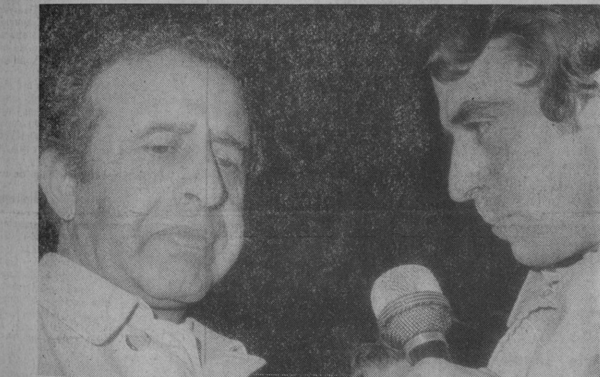
Madrid.—Un grupo de diplomáticos y funcionarios de la O. N. U., en número de 143, hicieron escala en Barajas de paso para Addis Abeba donde tendrá lugar una reunión del Consejo. En la foto, el presidente del Consejo, señor Aldurrahim El Farah, delegado de Somalia en la O. N. U., es interrogado por los periodistas a su llegada al aeropuerto.

De un total de 126 valores de valores contratados en renta variable, 60 suben, 30 bajan y 36 no varían. Índice general de la sesión: 104,95 contra 104,79.—Cifra.