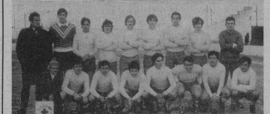
Equipo de fútbol Club Deportivo Riazano.

Zodiacos-Santa Bárbara. Tercera jornada: Calasancio-Zodiacos. Santa Bárbara-Esperanza.