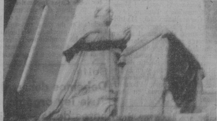
Estatua orante en alabastro que representa al cardenal Espinosa, obra de Pompeyo Leoni, en la parroquia de Martín Muñoz de las Posadas

disquisición histórica, más o menos cierta, dudosa o positiva, lo cierto es que, ya muerto el cardenal, noticia que recibió al parecer con cierta indiferencia Felipe II, al pasar éste con posterioridad por Martín Muñoz de las Posadas, dispuso fuese aplicada una misa por su alma, que oyó personalmente en compañía de sus hijos, al cabo de la cual dijo a estos: «Aquí descansó el mejor ministro que he tenido en mis reinados».