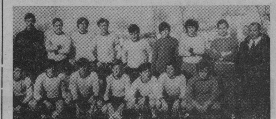
Equipo de fútbol de Los Angeles de San Rafael.