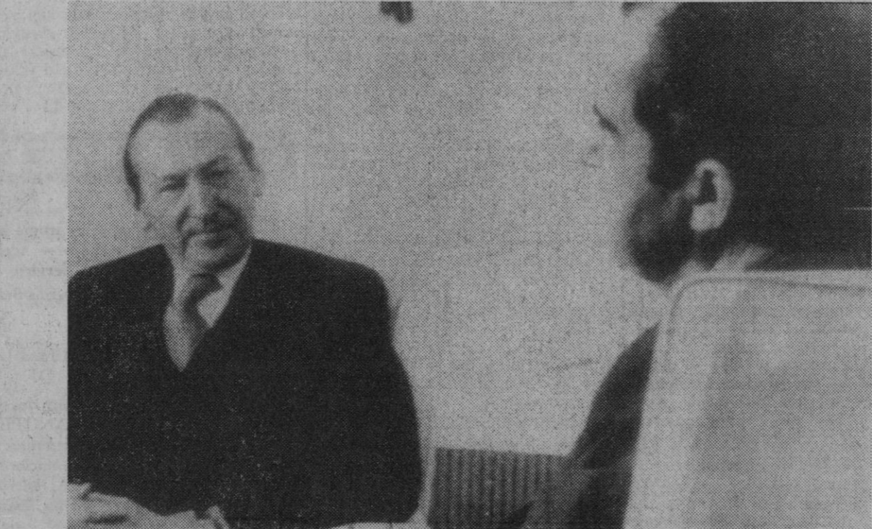
El secretario general de la O. N. U. que ha sido recibido por el presidente Nixon en la Casa Blanca, hará próximamente escala en Madrid antes de dirigirse a la reunión de Países Africanos.

nolulú - San Francisco - Nueva York-Madrid. El regreso por la ruta Tokio-Anchorage-Montreal-Madrid, estaba previsto en principio, en el caso de que el conflicto de los controladores canadienses hubiese finalizado.—(De «Pyresa»).