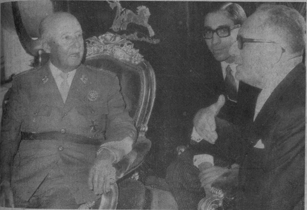
El Pardo.—S. E. el Jefe del Estado durante la audiencia especial en el Palacio de El Pardo al ministro francés de Asuntos Exteriores, M. Maurice Schumann, a quien acompañaban el ministro español Sr. López Bravo; embajador de su país en Madrid, y otras personalidades.

París, 26.—Todos los matutinos parisienses así como los diarios hablados de las emisoras de radio francesas hablan esta mañana en París de “la profesión de fe europea” hecha por el general Franco ayer en Madrid al ministro de Asuntos Exteriores francés, Maurice Schumann, y tres diarios, “Le Figaro”, “L'Aurore” y “La Nation” destacan esta declaración en los titulares de su información sobre la visita de Schumann a Madrid.