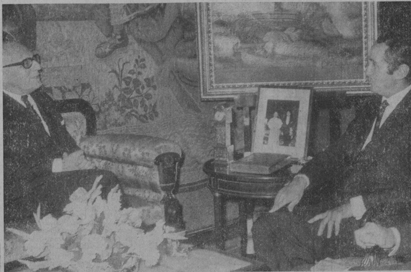
Madrid.—Los ministros de Asuntos Exteriores de España y Francia señores López Bravo y Schumann durante la primera entrevista que mantuvieron en la sede del Ministerio español durante la visita del Sr. Schumann a Madrid.

sede del Congreso, que lo normal es el mecanismo de dicho Consejo son las sesiones a puerta cerrada, y lo excepcional, las sesiones a puerta abierta.