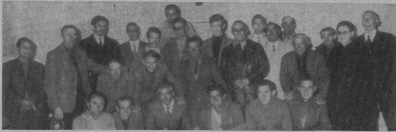
Los alumnos junto a las autoridades y profesores.