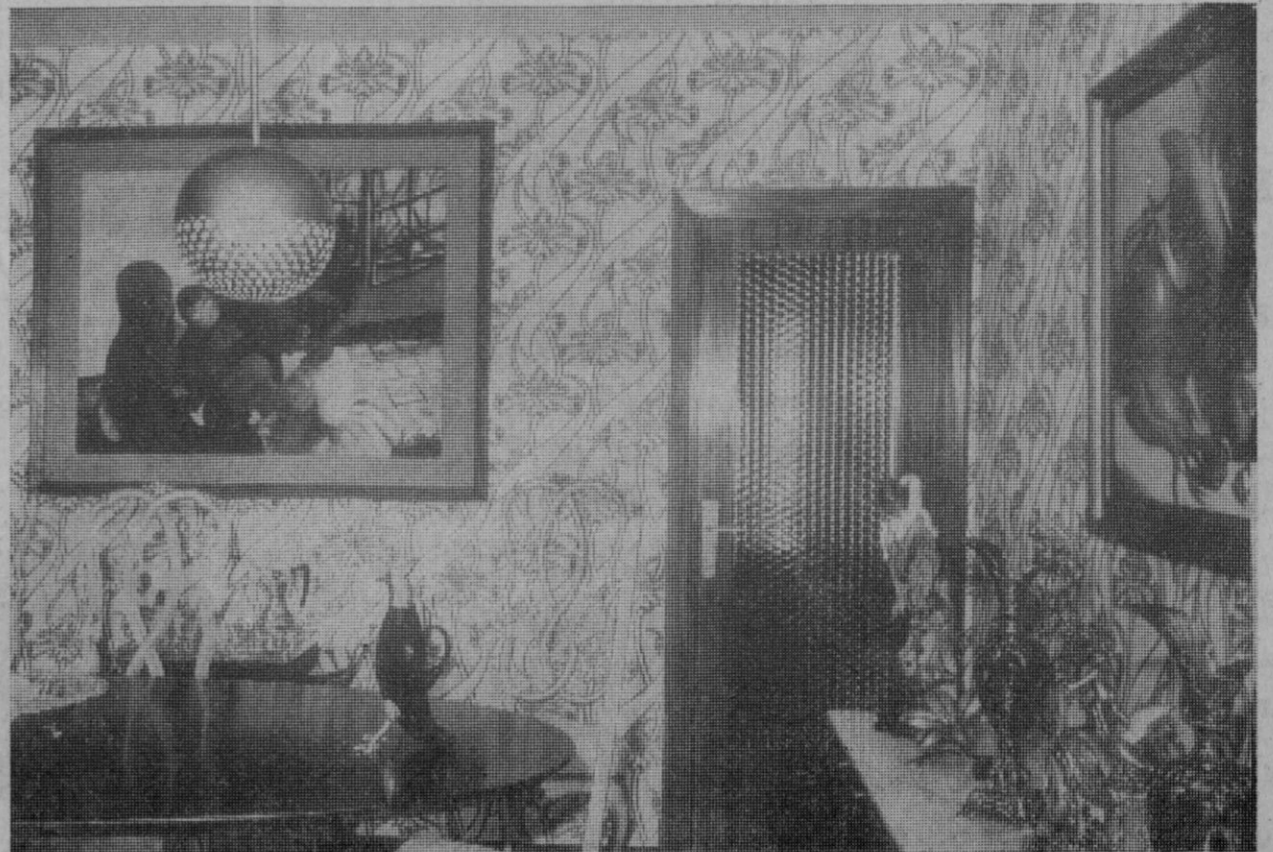
Este salón ha sido revestido con el nuevo procedimiento que lleva como nombre Mural FB. Decoración, «El Portalón de Guzca».