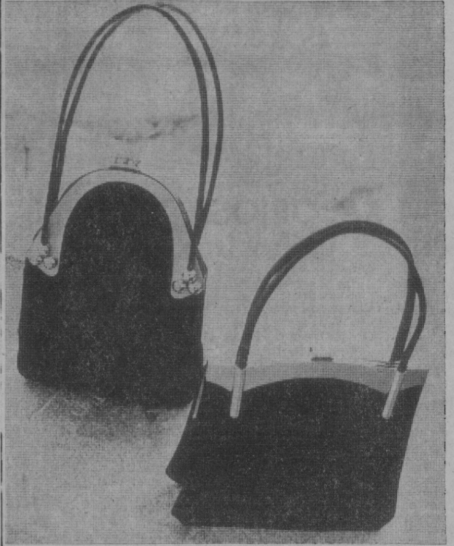
Tres bonitos modelos de bolsos, creación de José Gavilán.

La marroquinería—cuyo nombre parece proceder de la artesanía en cuero, tradicional de Marruecos—no ha podido ser sustituida por las nuevas técnicas de industrialización. Materiales nobles y un cuidadoso sistema de fabricación, casi artesanal, son imprescindibles a la hora de buscar belleza y calidad.