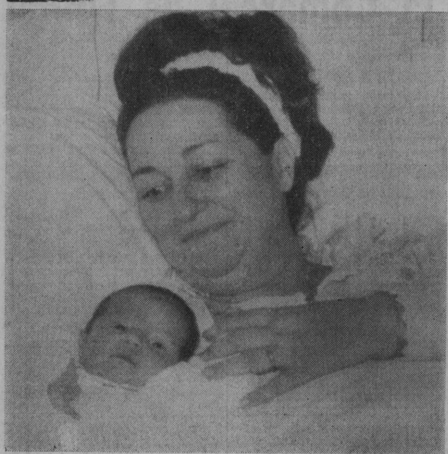
Barcelona.—Montserrat Caballé ha dado a luz una niña, el segundo hijo de su matrimonio, que pesó al nacer 3,800 kilos y que se llamará Montserrat, como su madre. La famosa soprano y su hija se encuentran en perfecto estado.