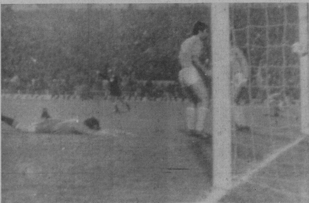
Granada.—Cuando un equipo es medianamente conocedor del oficio y el otro está empezando a saber dónde se encuentran colocadas las porterías en el campo, el resultado es este. España colocó a Chipre un 7-0 rotundo (dos goles más que Irlanda y uno más que Rusia), pero que no nos sirve para casi nada. En la foto un momento del encuentro.—(Telefoto Europa Press)

Bilbao, 25.—Cierra la jornada bursátil bilbaína de hoy con una sesión indiferente en todos los corros, con excepción del sector siderúrgico, donde altos hornos se ha visto muy animado.