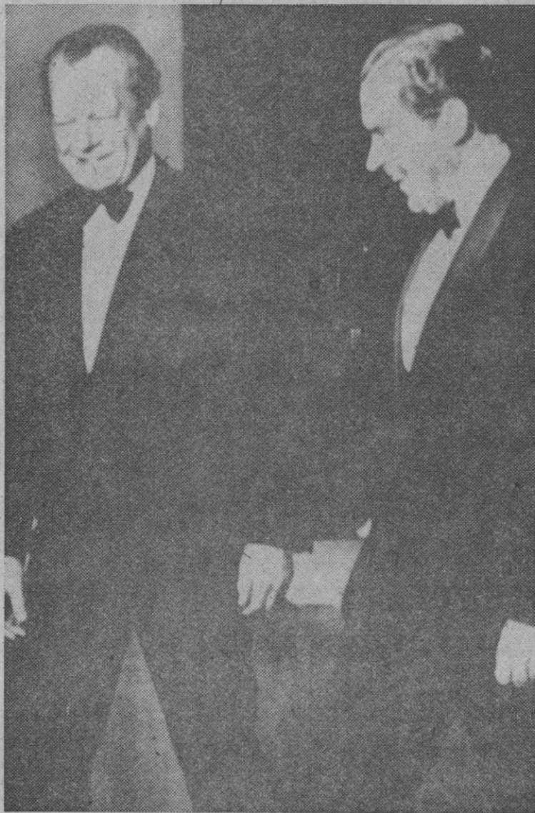
Washington.—El canciller de Alemania Occidental, Willy Brandt, y el presidente norteamericano, Richard Nixon, a su llegada para participar en una cena de gala en la Casa Blanca