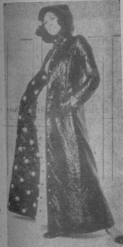
Largo abrigo de algodón plastificado negro, provisto de capucha, bolsillos de parche y cinturón con grandes trabillas. Forro de organdi negro, con bordado de flores naranja y negro. Se lleva sobre un traje largo color naranja, abrochado a un lado.