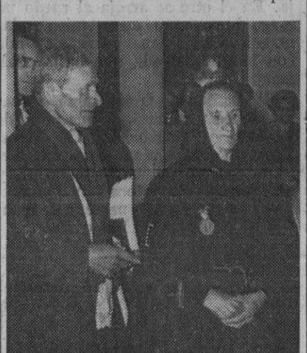
Francisco Lancha Azaña. Con cariñosas palabras dio la bienvenida al gobernador civil y al obispo al nuevo domicilio de la Delegación. Se dirigió luego a los premiados, a los que dedicó frases de elogios, poniéndoles como ejemplo para todas las familias. Hizo cariñosas referencias a los pre-