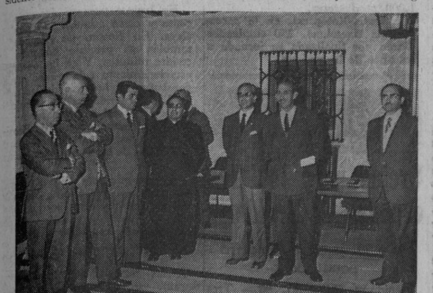
Las autoridades que presidieron el acto de entrega de premios, durante el mismo.

NOTA: Las tarjetas de asistencia a la comida homenaje en el castillo, se podrán retirar en Segovia en el restaurante "El Señorío de Castilla", y en Coca en el Ayuntamiento y en el bar "Cauca". Se ruega, por ser plazas limitadas, reserven o retiren su tarjeta antes del día 3 de mayo.