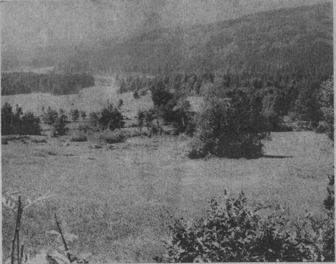
Munich.—Después de 4 años de preparación ha podido inaugurarse ahora en la selva de Baviera, el primer Parque Nacional de la República Federal de Alemania. El terreno, de 12.000 hectáreas de extensión, sirve en primer lugar para proteger animales salvajes, tales como el lince, el bisonte, el lobo y el castor. Será dividido en tres zonas: reservado en tierras altas, no accesibles a los visitantes; una zona de descanso y de excursiones y otra de recreo con piscina, cafés y plazas para juegos infantiles.

Nerja (Málaga), 1.—La cría del melón en invernaderos es la experiencia que está realizándose, por primera vez, en invernaderos especiales de plástico, en esta localidad. En estos invernaderos se obtienen temperaturas de hasta 45 grados, incluso en invierno, mediante el calor natural de la tierra y el sol a través de la tela de plástico que los cubre. Los resultados, al parecer, serán satisfactorios, ya que de momento, las plantas se encuentran totalmente desarrolladas, con buen aspecto y repletas de flores prometedoras de abundante fruto. SANDIAS, CALABAZAS Y PEPINOS De esta manera, y de conseguirse buenos resultados, la cosecha de melones se adelantará en varios meses con el consiguiente beneficio para el agricultor. El experimento se extenderá a otras hortalizas, tales como sandías, calabazas y pepinos.—Cifra.