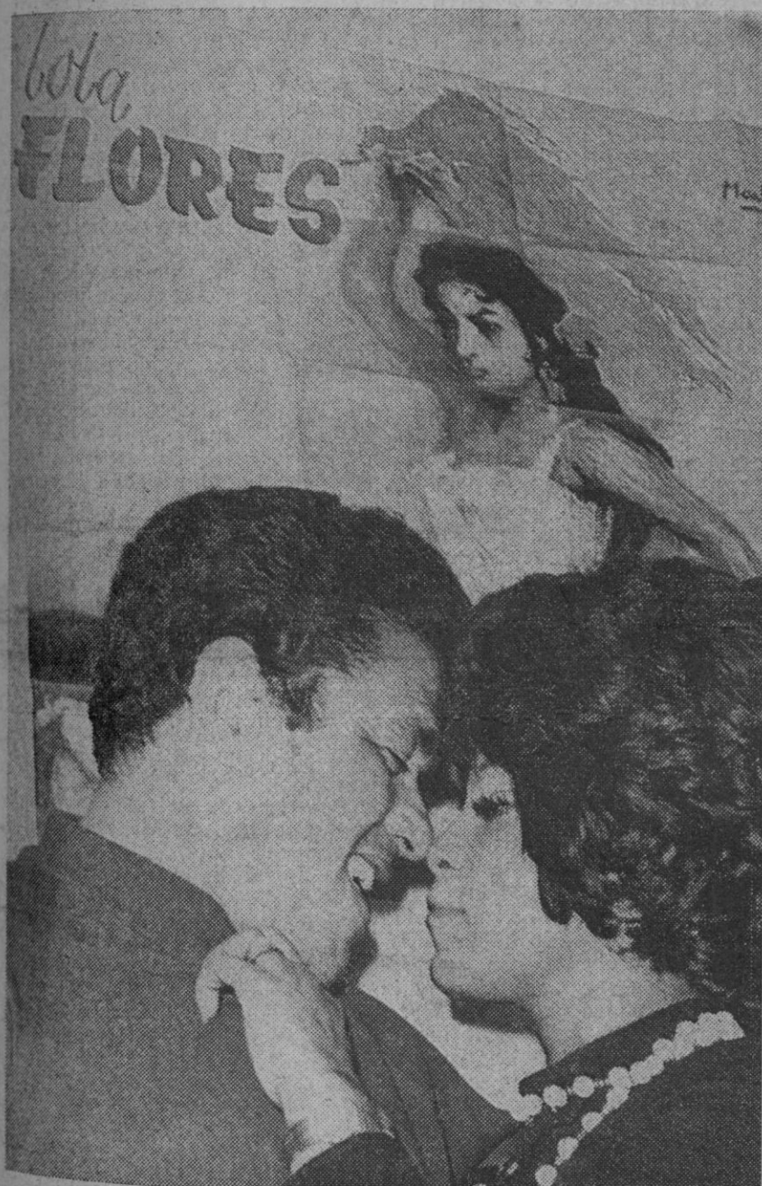
Garrincha, el famoso extremo derecha de la selección brasileña, que fue la estrella en dos campeonatos mundiales, ha llegado a Madrid acompañando a la cantante brasileña Elsa Soares.