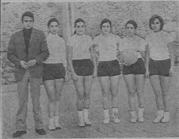
Equipo femenino de baloncesto de la Escuela del Magisterio.

—Para la juventud deportiva cuellarana, dentro y fuera del club, pediría: primero, a ellos, constancia en el deporte; segundo, a las federaciones material deportivo, ya que hoy día éste no está al alcance de un club modesto e incipiente. Y por otra parte las instalaciones anteriormente expuestas.