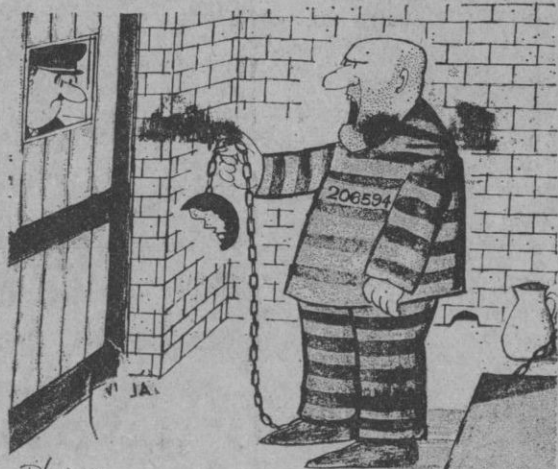
—Mire lo que han hecho sus simpáticos ratones

Distribuidor exclusivo: Casa Solera. Corpus, 7