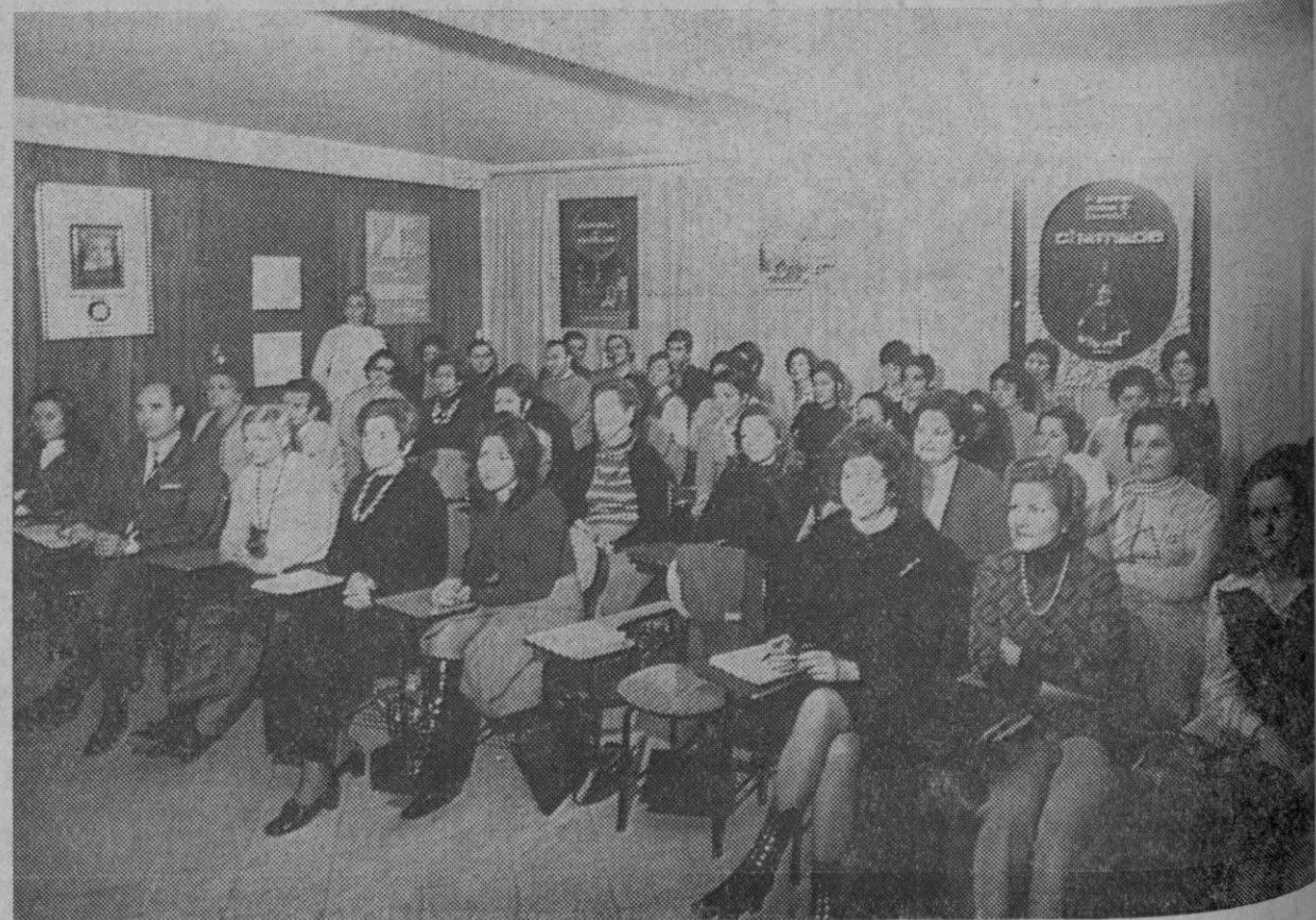
En la foto una representación de Perfumería Cabrero (Segovia)

Consejero-Vendedor, una nueva dimensión en la venta