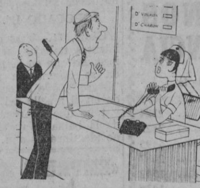
—No hay urgencia que valga... Espere su turno...

NOVIOS: Regalamos 20.000 ptas. en muebles Sorteo el día 1 de marzo ante clientes Cooperativa San Frutos: Proveedor muebles lázaro (Facilidades de pago) y además repartimos beneficios