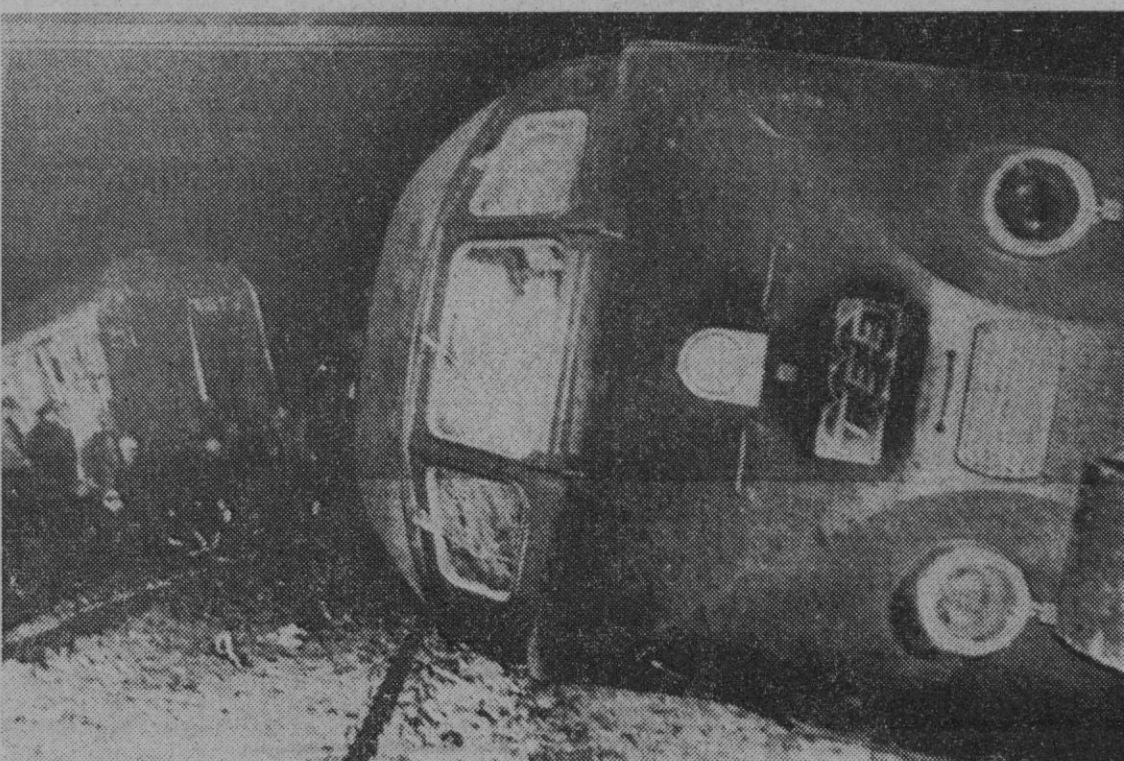
Aitrang (Alemania).—La máquina del «Baviera TEE Express» aparece volcada a un lado de la vía, tras el descarrilamiento.

La prohibición, que se extiende también a los bailes públicos, especifica que las infractoras serán denunciadas por atenido contra el pudor. De anterioridad se prohibió el uso de vestidos que imitan ornamentos religiosos o militares.