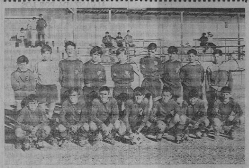
Equipo infantil de la Gimnástica Segoviana.

Clubs Multa por incidentes del público al Rayo Vallecano.