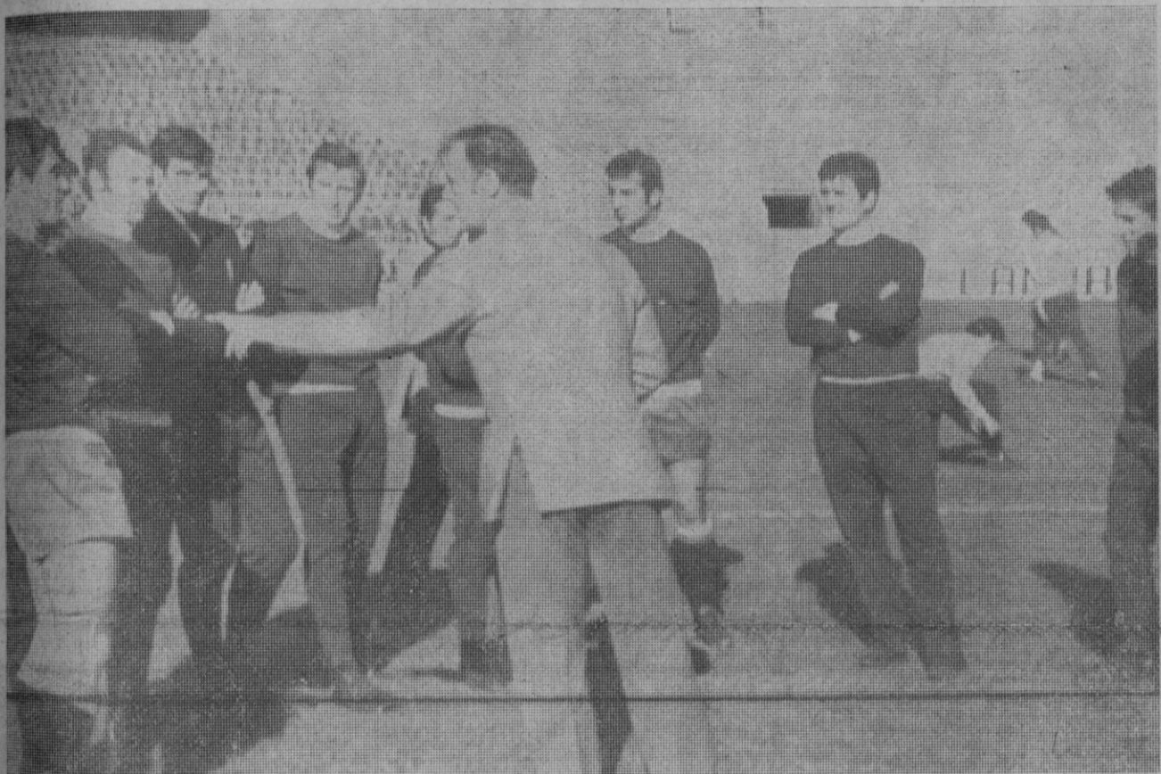
Valencia.—El seleccionador nacional, Kubala, conversando con los componentes de la selección "A" antes de iniciar el entrenamiento llevado a cabo ayer mañana en Valencia.

El ministro de Hacienda pronunció unas palabras para agradecer a los representantes de los Bancos que han intervenido en el convenio, y muy especialmente a los que han actuado de «managers» en la negociación del préstamo, la colaboración y eficacia prestadas durante la fase de preparación del mismo. Igualmente agradeció al Banco de España su cooperación para el buen fin de estas negociaciones.—Cifra.