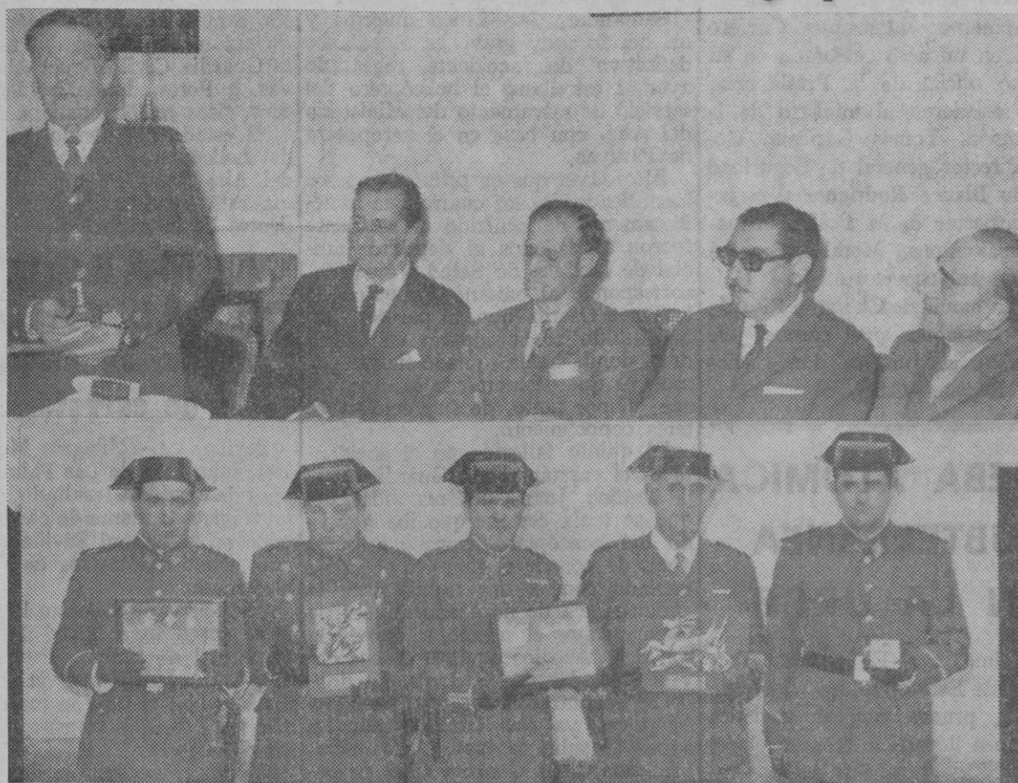
En la fotografía superior, la presidencia del acto, y en la inferior, algunos de los miembros de la Benemérita galardonados.