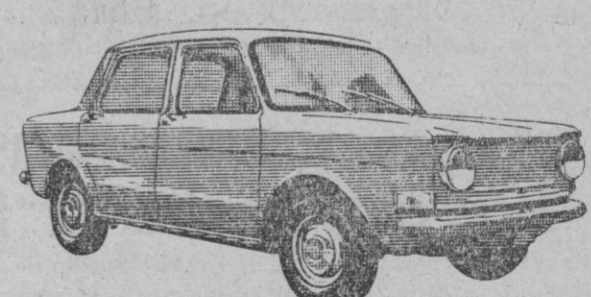
Simca 900-un coche por el precio de un cochecillo

Ofrecemos: Tomar su coche usado. Cómodos plazos mensuales. Demostraciones sin compromiso. Visitenos con su familia, incluso sábados tarde.