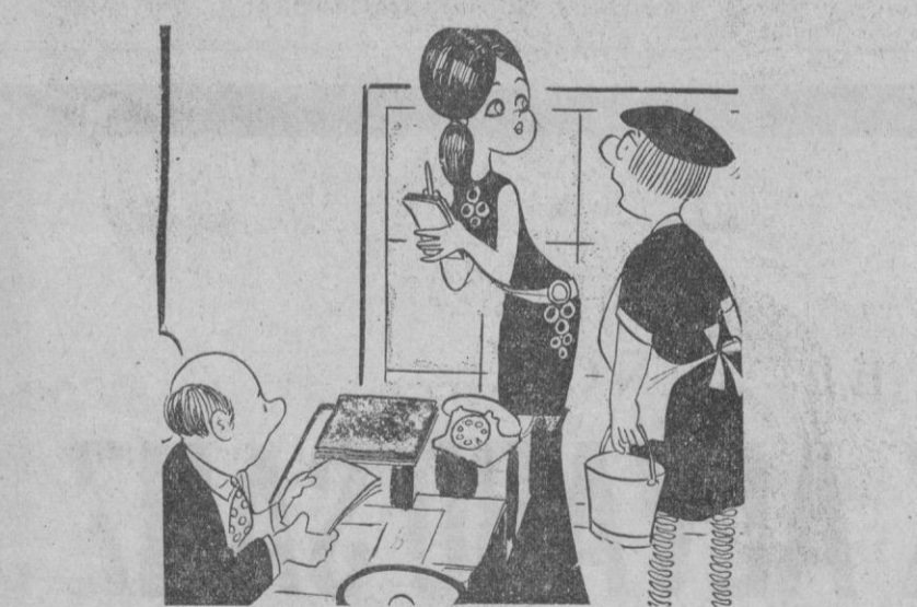
—Cuando termine con el jefe, la dictaré una carta para mi primo del pueblo...

SOLO CUESTA 18.139 PTS. Distribuidor exclusivo: CASA SOLERA Corpus, 7