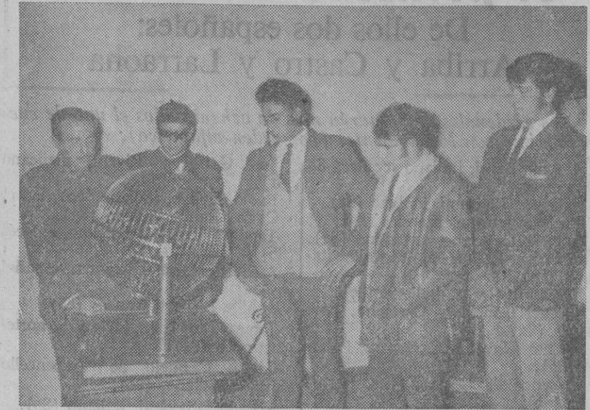
Momento en que se inicia el sorteo.

SALOME en segovia Jueves en el Teatro Juan Bravo