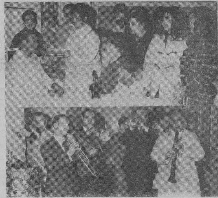
Según informamos en la sección de local, hoy han celebrado los músicos la festividad de su Patrona, Santa Cecilia. Entre los actos programados se ha ofrecido una comida a los acogidos en el Hospital de la Misericordia (foto superior) y en aquel mismo centro (foto inferior) un grupo orquestal dio un pequeño concierto en honor de los enfermos.