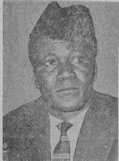
Sekú Turé, presidente de Guinea

A los mercenarios se les encomendó la captura de objetivos militares