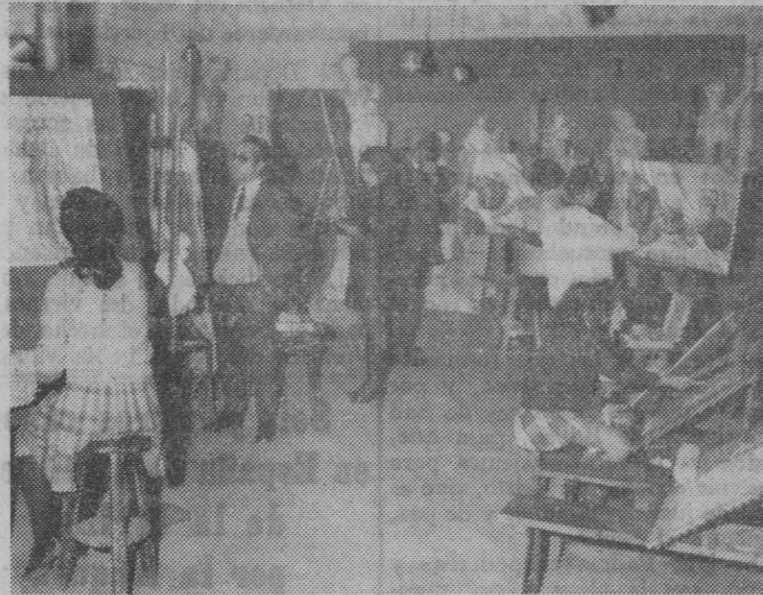
La clase de dibujo.

Hace mucho tiempo que nada se publicaba respecto a la actividad desarrollada por la Escuela de Artes y Oficios de nuestra capital. Son de esas cosas que sabemos que existen, pero que no tienen una proyección exterior importante y, por consiguiente, no son del todo conocidas.