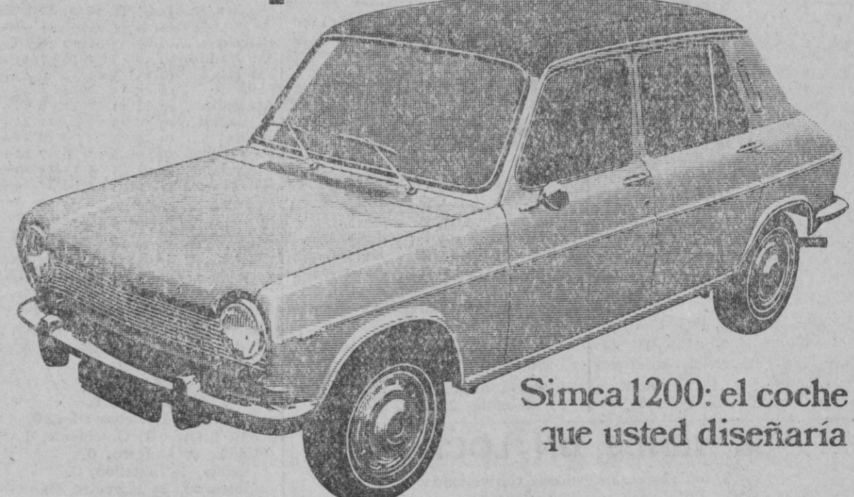
Simca 1200: el coche que usted diseñaría