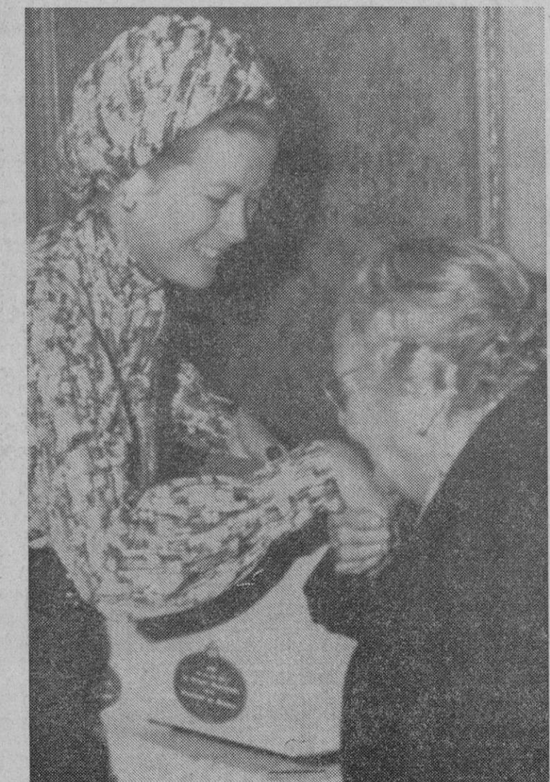
Mónaco.—Una mujer mayor besa la mano de la princesa Grace de Mónaco, que como presidenta del comité local de la Cruz Roja entregó varios paquetes a las personas más necesitadas en la víspera del Día Nacional de Mónaco.