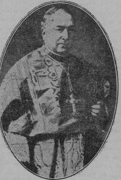
II.—El Cardenal Gasparri, que hasta ahora ha desempeñado el cargo de Secretario de Estado del Vaticano.