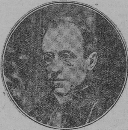
I.—El Cardenal Pacelli, nuevo Secretario de Estado del Vaticano.