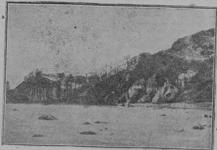
El día 11 de Febrero de 1858, hoy hace 72 años, tuvo lugar la primera de las Apariciones de Ntra. Señora a Bernardita Soubirous en las rocas de Massabielle. El presente fotograbado representa aquel agreste paraje tal como entonces estaba. Encima de las rocas que santificara con su presencia la Virgen Purísima, se levanta ahora la magnífica basílica que todos conocemos.

Para su mayor difusión popular, el "Instituto de la Mujer que trabaja" contará también con el concurso de agentes gestores.