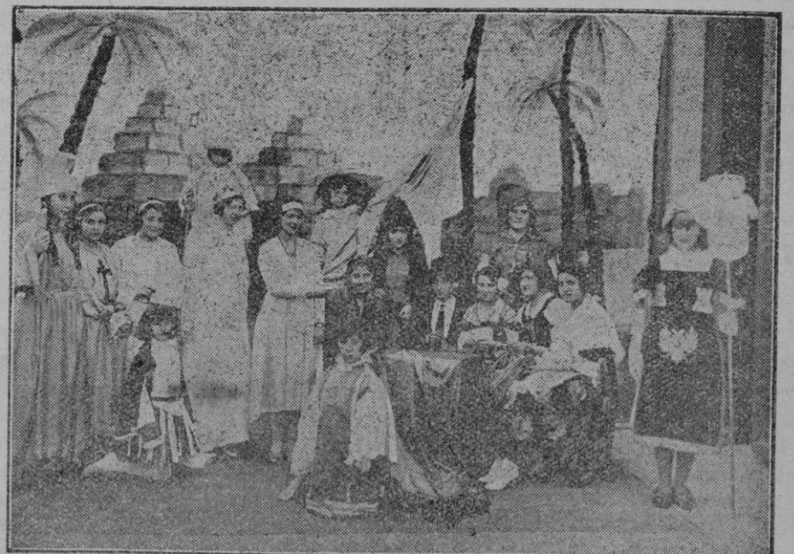
"España y América", Loa patriótica, estrenada en el Colegio de la Pureza el día 2.