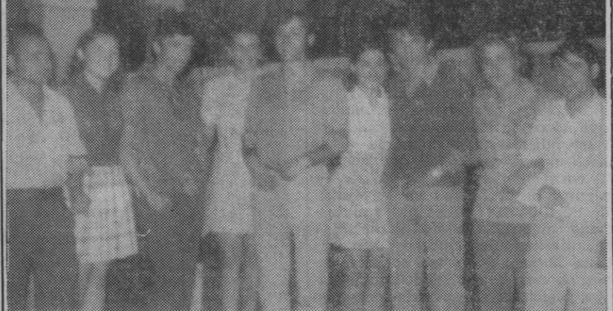
La corregidora de las fiestas y unas amigas se fotografian junto a los presidentes de las pandas cuellaranas.