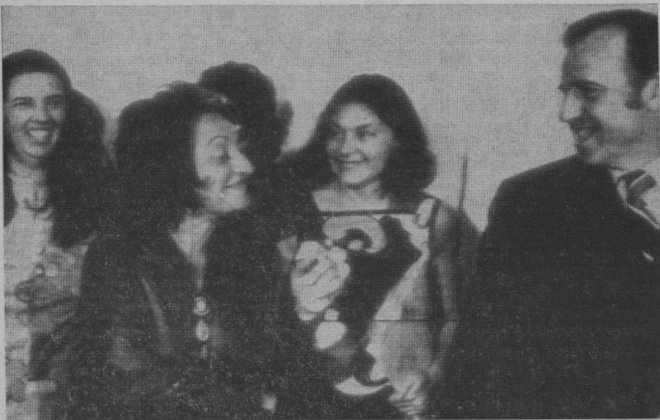
Nueva York.—El senador Charles E. Goodell, (derecha) escuchando a Betty Friedan, (segunda por la izquierda) una de las líderes de la "Huelga por la Igualdad" de las mujeres, durante una conferencia de prensa en Nueva York.—.