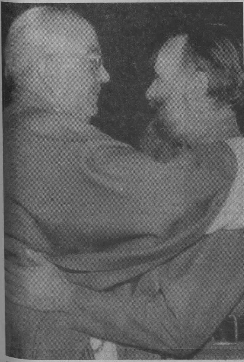
Salamanca.—El reverendo monseñor Anthony Bloom, de la Iglesia oriental ortodoxa, abraza al obispo de la Iglesia española reformada episcopal, reverendo Ramón Taibo Sienes, durante el acto celebrado en la santa iglesia católica de la Purísima, dentro del programa del Congreso Ecueménico de la I. E. F.

Madrid, 28.—La ordenanza de trabajo, para las industrias de producción, transformación, transporte, transmisión y distribución de energía eléctrica, se aprueban por orden del Ministerio de Trabajo que inserta hoy el «Boletín Oficial del Estado».—Cifra.