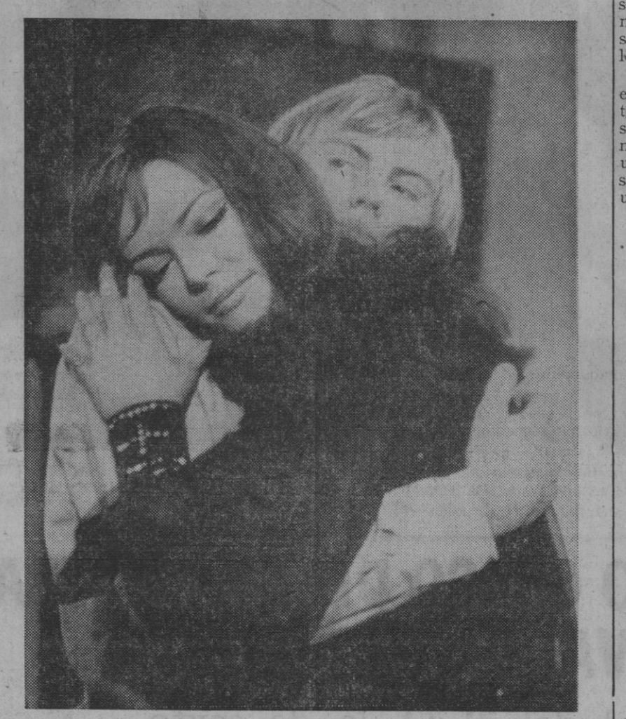
Una escena en la que aparecen los dos protagonistas del film

La película alemana «Hänsel y Gretel se perdieron en el bosque», ha sido realizada por F. J. Gottlieb, y su productor es uno de los pilares del joven cine alemán: Hansjürgen Pohland. A la edad de 21 años, Pohland fundó en 1955 una productora