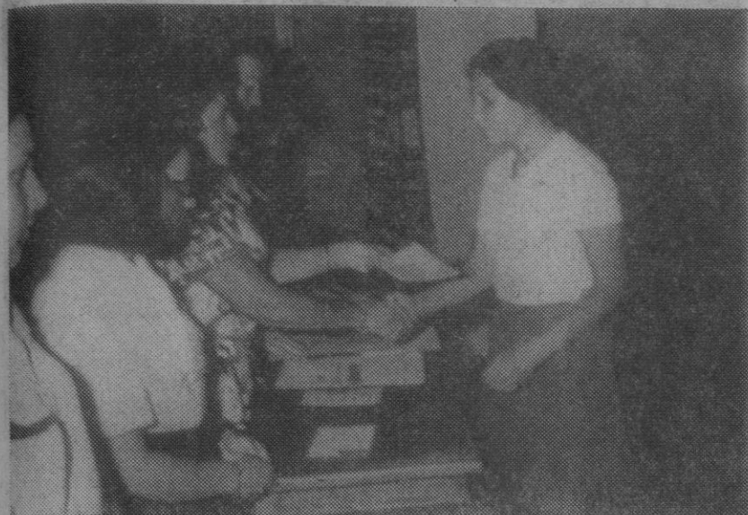
Entrega de certificados al finalizar el curso.

En la Escuela menor de Formación «Alto de los Leones de Castilla», de Sección Femenina, ha finalizado un curso de capacitación de tiempo libre, que ha venido realizándose durante 28 días y al que han asistido 80 alumnas de Magisterio en régimen de internado-externado. Las materias que se han llevado a cabo a lo largo del curso han sido todas las dedicadas a los cuestionarios de actividades de tiempo libre, siendo los temas fundamentales: La importancia político-social de las actividades de tiempo libre. Necesidad de una educación para el tiempo libre. La actividad como instrumento formativo, y la dirección de las actividades. También se han hecho actividades artísticas, musicales, literarias, cine, periodismo, actividades deportivas, formación religiosa, formación político-cívico-social, etc. En todas las materias se ha resaltado la importancia y dedicación que éstas tienen en la formación del niño. Así, las llamadas escuelas nuevas forjan su programación basándose en la necesidad que el niño tiene no sólo de una instrucción, sino de un des-