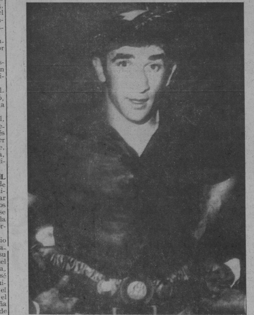
Paris.—Con la infaltable chapela vasca, José Manuel Ibar "Urtain", se ciñe el cinturón de campeón de Europa de los pesados.

A las siete y media del lunes próximo, se reunirá en su domicilio social, Casa del Deporte, el pleno de la Federación Segoviana de Balonmano. En el transcurso de la sesión será elegido el nuevo presidente.