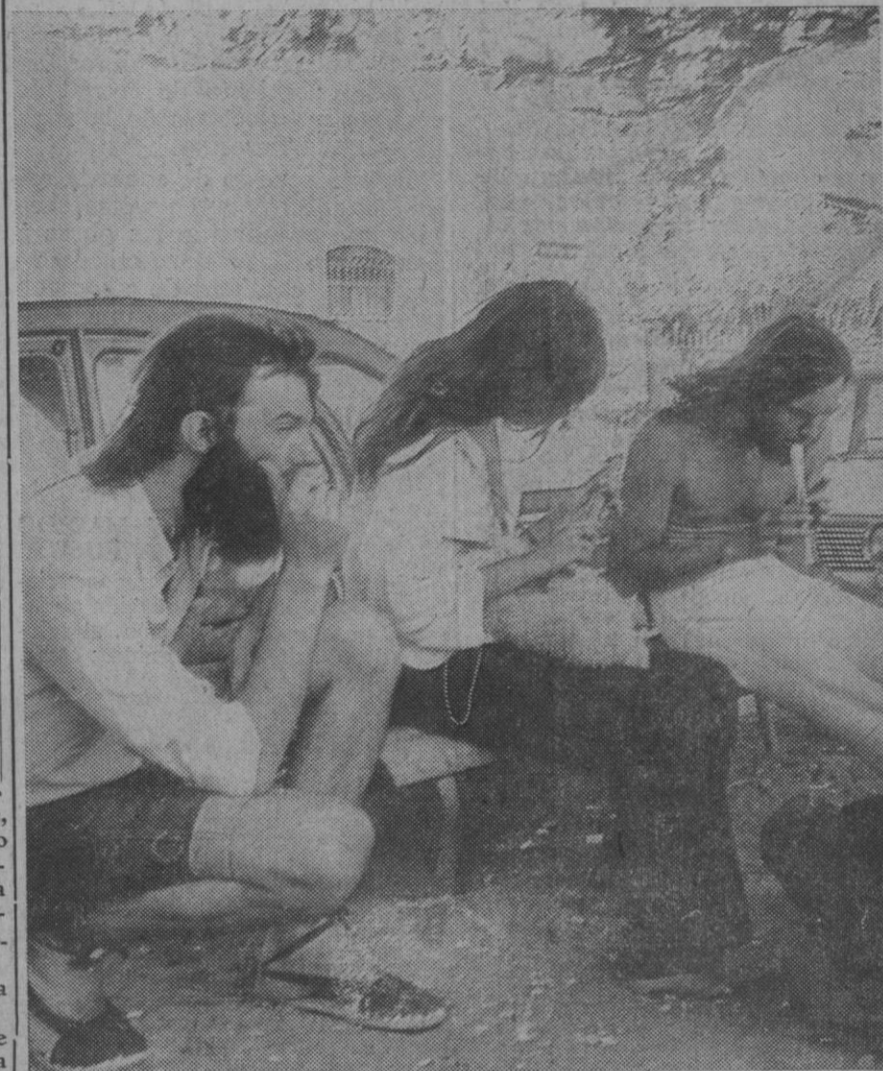
No estos "hippies" de la foto, naturalmente, pero sí otros con atuendos y actitudes similares han llevado la marihuana a Cadaqués. La Policía vigila y aún no ha encontrado nada, pero parece ser, según algunas informaciones hechas públicas, que aunque la villa no huele a marihuana, la droga ha tomado ya a Cadaqués, como antes lo hiciera Barroja