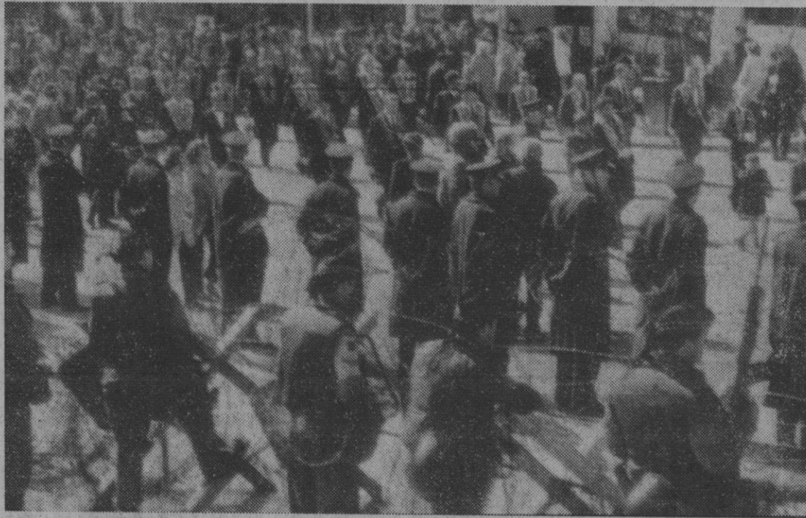
Belfast.—Tropas y policías ante las alambradas durante el desfile de los miembros de la orden de Orange en la capital del Ulster.