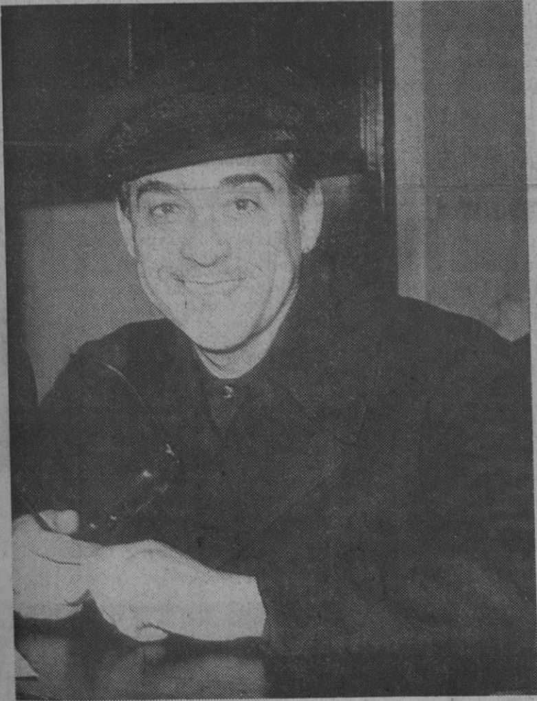
El famoso cantante español Luis Mariano, fallecido en la madrugada de hoy en el hospital de Salpêtrière, en París.

París, 15.—Los restos mortales de Luis Mariano serán trasladados a la localidad de Arcangues (próxima a Biarritz), y serán enterrados en el pequeño cementerio de la localidad el próximo sábado, día 18, según declaró a la agencia Efe esta mañana en París la esposa de Marcel Lamy.