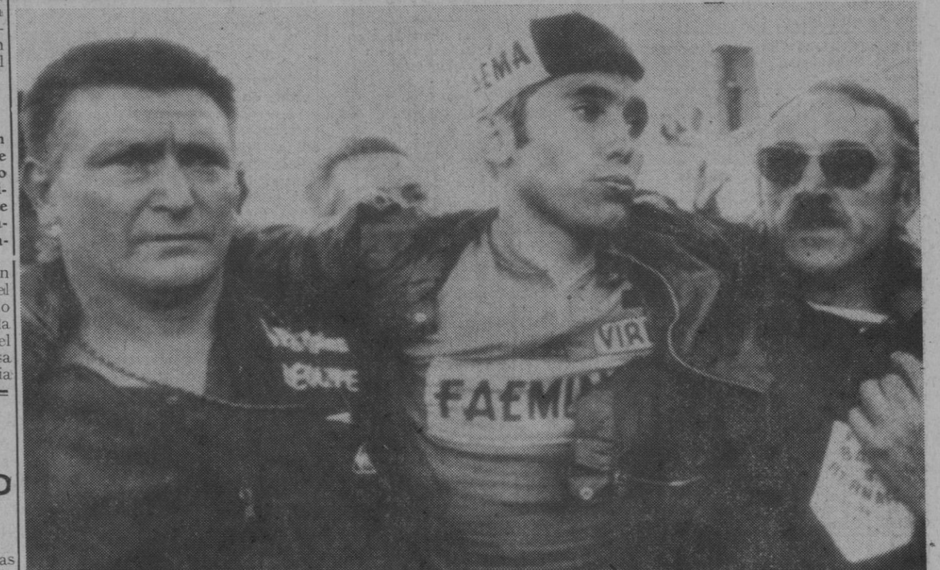
La subida al Mont Ventoux fue dura, terriblemente dura. Si no, ahí está el campeón Merckx, ayudado por dos asistentes, que le llevan a la ambulancia después de que el belga, eso sí, ganase la etapa en solitario.

Irún, 11.—Se está registrando durante los presentes días una notable afluencia de turistas por los puentes internacionales. Se calcula que por lo que respecta a esta primera quincena de julio, están llegando bastantes más turistas que en años anteriores por las mismas fechas.—Cifra.