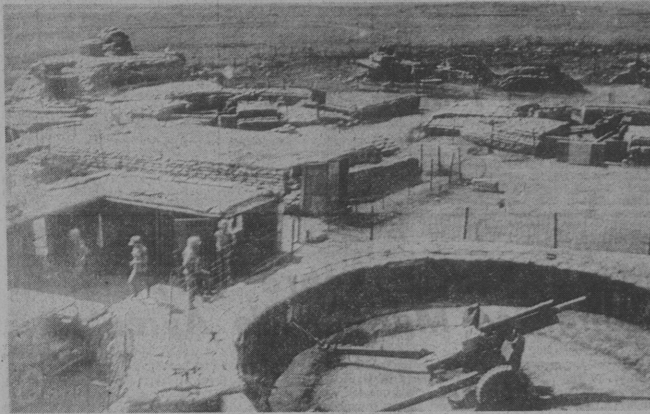
Tropas de Vietnam del Sur en los emplazamientos de obuses "T-Bone" cerca de la frontera desmilitarizada. La foto fue tomada por el reportero de AP, Danie del Luce, que dice en su información que esta división es la mejor armada.—(Telefoto AP-Europa Press)

Seguidamente, la nieta del Caudillo actuó de madrina en la ceremonia de la bendición de la capilla de la Escuela de Ingenieros Técnicos Agrícolas y en la entrega de los diplomas de la primera promoción de la mencionada Escuela.—Cifra.