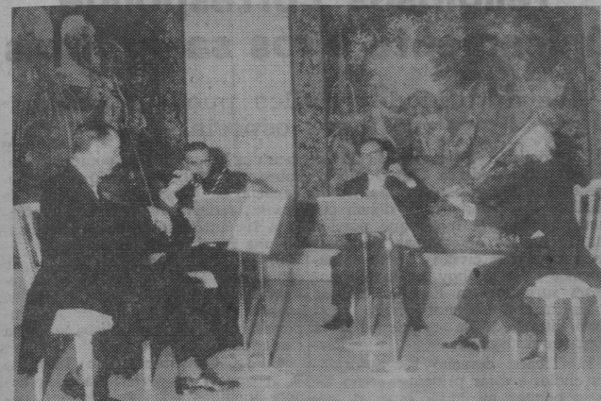
El Cuarteto Clásico en su concierto de ayer.