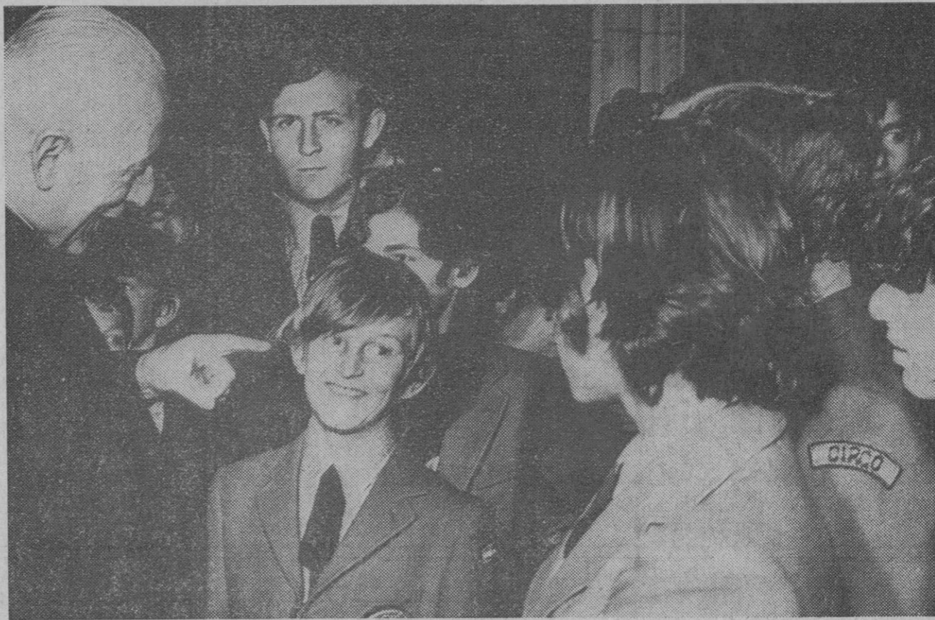
París.—El arzobispo de París, monseñor Marty, durante la audiencia que mantuvo con los muchachos que componen el "Circo Ciudad de los Muchachos". Actualmente se presentan en París con su espectáculo.

Se calcula, aproximadamente, que unos dieciséis millones de italianos han acudido a las urnas, cuando el cuerpo electoral está formado por más de treinta y cinco millones y medio de personas. Como se sabe, la jornada electoral se prolonga hasta mañana, lunes; los colegios serán abiertos de nuevo a las siete de la mañana y se cerrarán definitivamente a las dos de la tarde, hora local.