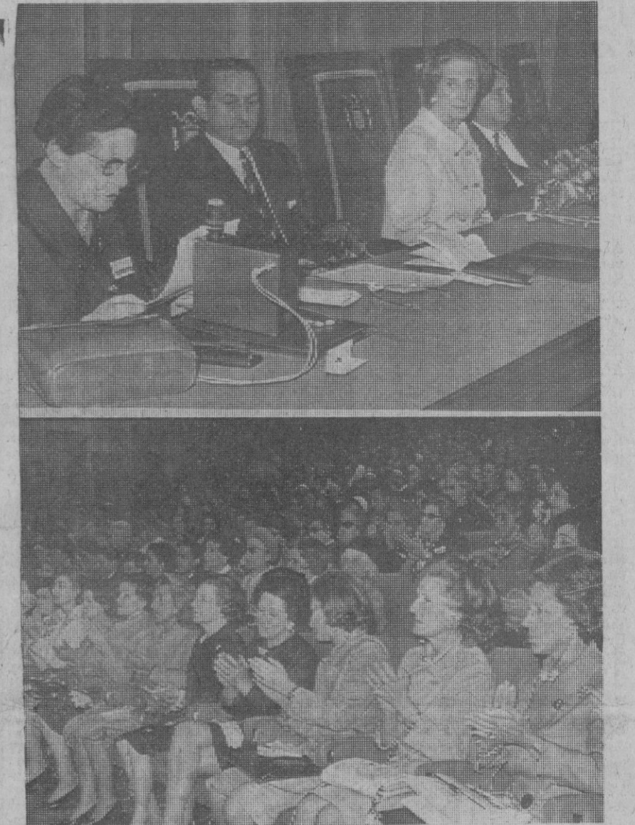
Madrid.—Arriba, una vista de la presidencia del Congreso Internacional de la Mujer, a cuyo acto inaugural asiste doña Carmen Polo de Franco; la delegada de la Sección Femenina, Pilar Primo de Rivera, y los ministros de Información y Turismo, señor Sánchez Bella, y secretario general del Movimiento, señor Fernández Miranda. Abajo, una vista de la sala llena de congresistas durante la jornada inaugural.

En el Palacio de Exposiciones y Congresos del Ministerio de Información y Turismo