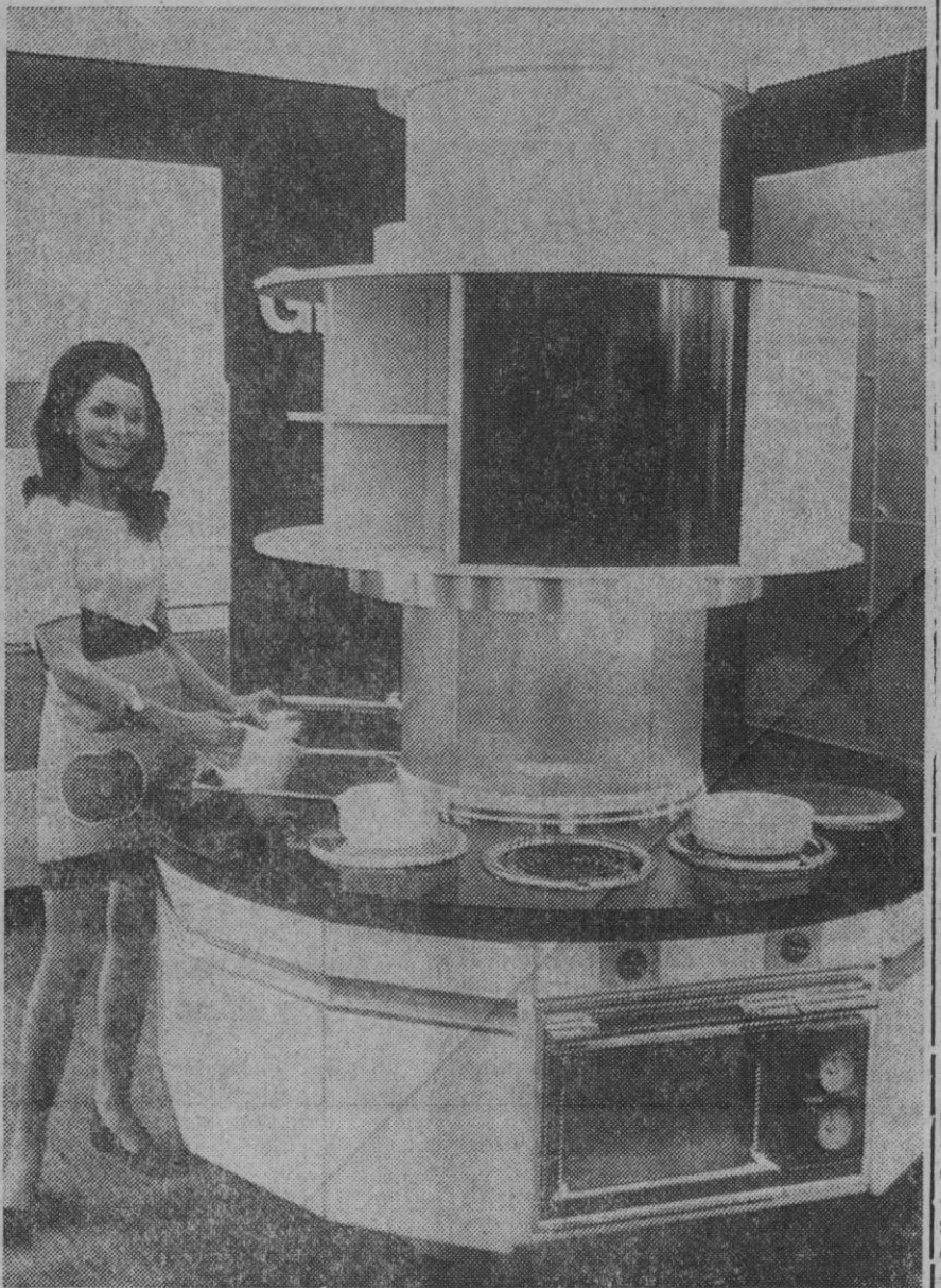
Hamburgo.—Es el colmo de la comodidad. La cocina redonda representa el «último grito» tanto para restaurantes como para casas particulares modernas y es el centro del lugar de trabajo para cocineros en jefe o para amas de casa. La cocina, de cuatro placas, con parrilla y horno, el que a primera vista parece ser un televisor, así como con fregadero, está dispuesto de modo giratorio y ajustable verticalmente, de manera que podrán trabajar en el artefacto cómodamente personas grandes y pequeñas. En la parte superior de la columna se encuentran estantes para ingredientes, condimentos y otros utensilios de cocina; abajo, armarios para las ollas y la vajilla así como gavetas para los cubiertos. Acaba de ser presentada al público esta práctica novedad en la Exposición Federal del Ramo de Hostelería y Gastronomía en Essen (República Federal de Alemania).—DAd.

«Que en cumplimiento de la «política de información diáfana» que el nuevo Gobierno piensa practicar con el fin de que la opinión pública pueda juzgar de su gestión y manifestar sus puntos de vista», se facilite—por de pronto, de hecho, y después por ley—, como en las democracias occidentales, la labor de los representantes de la prensa y demás medios de difusión, para que ellos puedan informar directa y completamente acerca de cuantos asuntos relacionados con la gobernación del país interesen a todos los españoles—como los que se tramitan y discuten en el palacio de las Cortes por las diversas comisiones, sin exceptuar la creada para el caso Matesa—y se den las necesarias instrucciones a fin de que el presente escrito y sus firmas sean leídos en la televisión y Radio Nacional.»