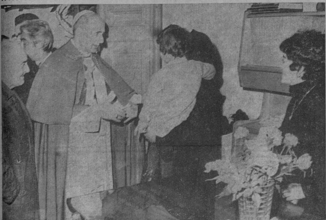
Roma.—Su Santidad el Papa Pablo VI entra en una de las casas de los suburbios de Roma, donde (con motivo de la festividad de la Navidad) visitó a sus moradores. Su Santidad fue aclamado por los habitantes de estos barrios, que le recibieron dando continuas muestras de cariño hacia su persona.

León, 26.—En la montaña nevó el día de Navidad copiosamente. El temporal, interrumpido a ratos, continuaba en la mañana de hoy. Numerosos puentes, entre los que figuran los de San Isidro, Tarda, Las Señales, San Glorio, Somiedo y Leitariegos, están cerrados al tránsito. Por el de Pajares se puede pasar con ayuda de cadenas.