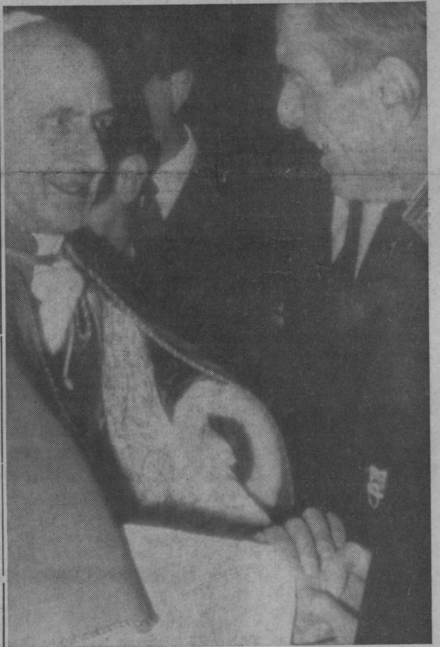
Roma.—El Santo Padre saludando al embajador español ante la Santa Sede, don Antonio Garrigues y Díaz Cañabate, cuando llegó a la Plaza de España para conmemorar el dogma de la Inmaculada.

El trofeo consta de una copia con una inscripción en la base que dice lo siguiente: «En reconocimiento a su dedicación al servicio público, de todos los hombres y mujeres de la comunidad mundial».—Efe.