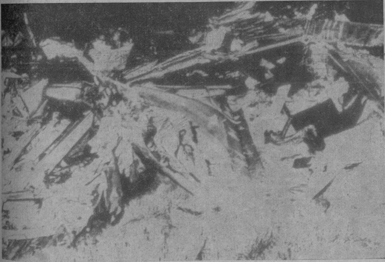
Atenas.—Restos del aparato "DC-6" de las Olímpia Airways que se estrelló cerca de las costas de Atenas. Los noventa ocupantes del aparato resultaron muertos, convirtiéndose ésta en la mayor catástrofe aérea de la aviación comercial griega.

Jerusalén, 9.—Los esfuerzos de la primer ministro designada, Golda Meir, para formar un nuevo Gobierno israelí, sufrieron anoche un nuevo retroceso, al negarse a participar en él, en el último momento, el partido derechista "Gahal".—Efe-Upi.