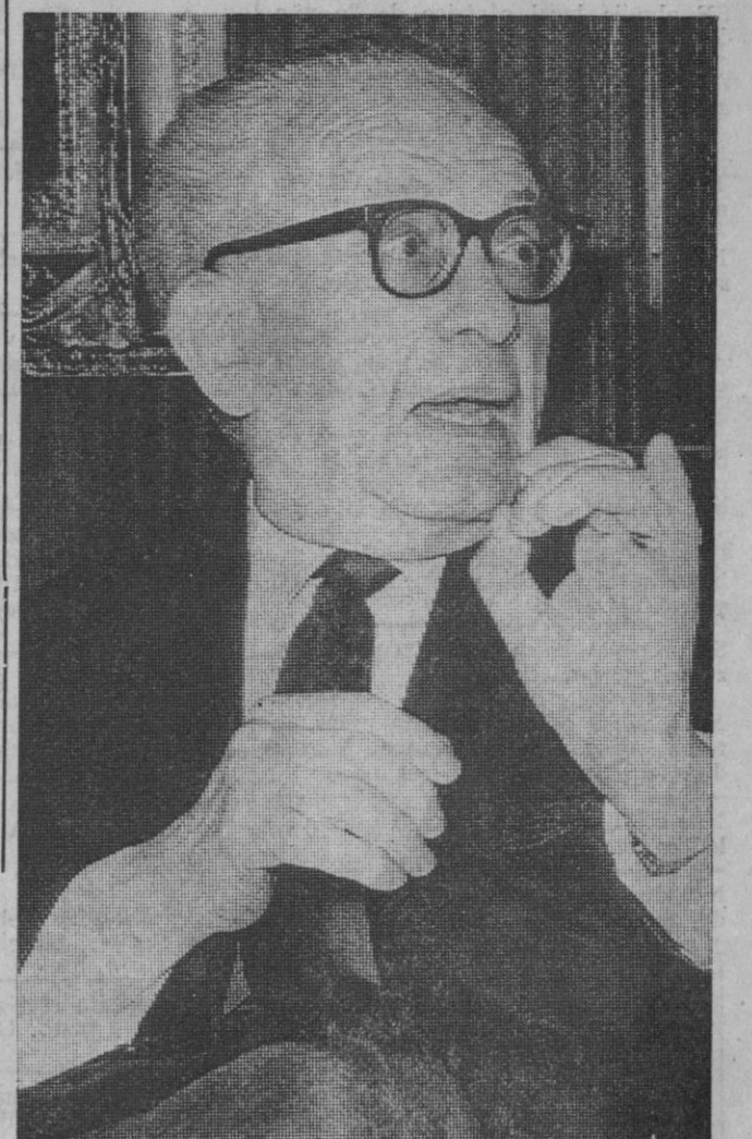
Este es el escritor Max Aub quien, como informamos recientemente a nuestros lectores, ha vuelto a España después de treinta y tres años de ausencia. Viene con intención de escribir un libro sobre Buñuel. Afirma que la gran tragedia de nuestros días está en que se va en busca de la ciencia y, en el fondo, la ciencia nada tiene que ver con el arte. De nuestra patria dice que la España que hoy contempla en nada se parece a la que abandonó.—(Foto Europa Press).

Esta tarde, a las cuatro y media tuvo lugar el entierro del que fuera popular matador de toros y gran amigo de todos los toreros.—Cifra.