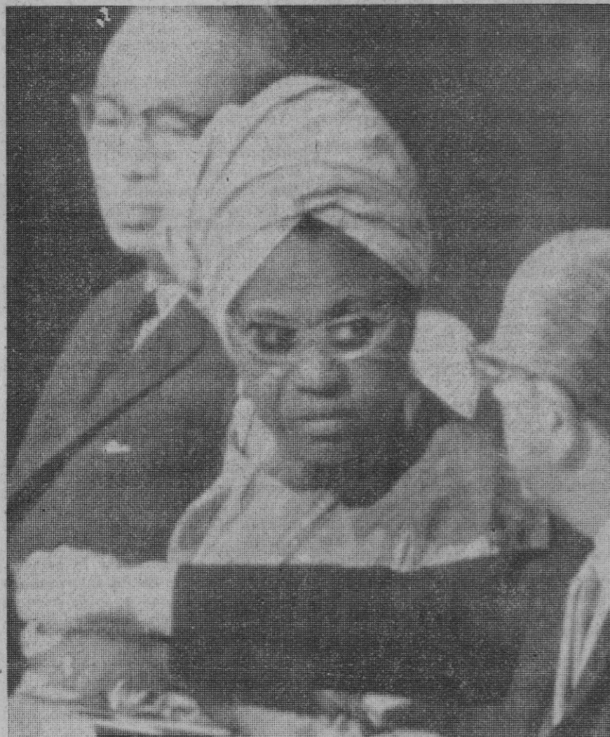
Naciones Unidas.—Angie Brooks, representante de Liberia en la O. N. U., y que fue elegida presidente de la Asamblea General, aparece con U Thant y con Constantín Stavropoulos, en la sesión de apertura de la Asamblea General.

Ha llegado a la capital un equipo de Televisión Española, que hará un amplio reportaje de todos los detalles de esta monumental obra.