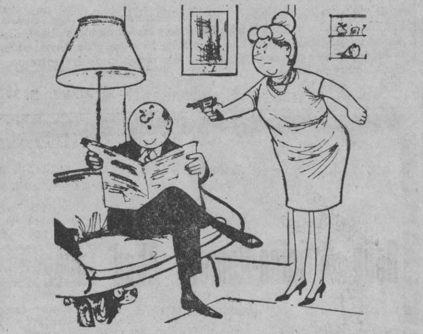
—Por última vez, ¡la comida está servida!

Viva mejor y más confortable Renueve su mobiliario en MUEBLES COOPERATIVA SAN FRUTOS Proveedor MUEBLES LAZARO (Faustino Lázaro)