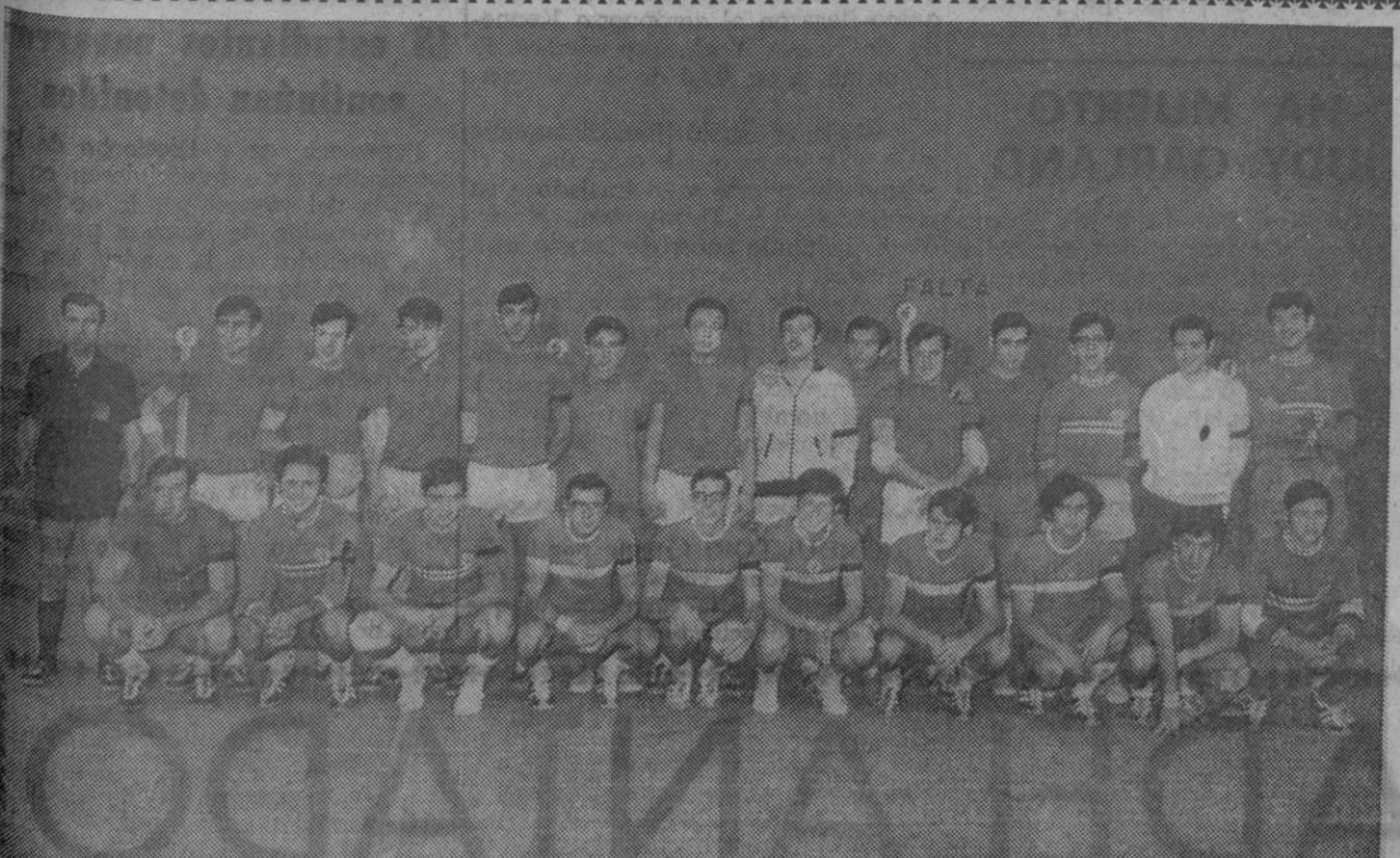
En el pabellón deportivo se jugó ayer un encuentro amistoso de balonmano entre los equipos del Parque Móvil y Eresma de la Guardia de Franco, cuyos componentes figurán fotografiados conjuntamente. El encuentro finalizó con la victoria segoviana por 28-16.

París, 22.—El español Eladio Vallduví ha ganado la medalla de bronce, correspondiente al tercer puesto en la clasificación, en los campeonatos de Europa «junior» de tiro al plato, modalidad fosa olímpica, que han finalizado hoy en D'Arcy, cerca de París.