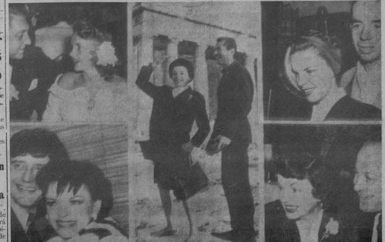
Nueva York.—Judy Garland, que ha muerto en Londres, es mostrada en estas cinco fotografías de archivo en compañía de sus cinco maridos. Arriba a la izquierda, con David Rose 1942; abajo a la izquierda, con su último marido Mickey Dean, en diciembre de 1968. En el centro, en Grecia, con Mark Herron, en 1964. Arriba a la derecha, con Vicent Minelli, en 1945. Abajo a la derecha, con Sid Luft, en 1953.

Las principales figuras de la cinta, héroes del descubrimiento de América, Cristóbal Colón y la Reina Isabel, han sido interpretadas por los españoles Francisco Rabal y Aurora Bautista.—Efe.