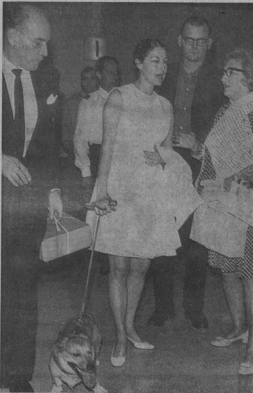
Madrid.—En el aeropuerto de Barajas, pasando por la aduana, vemos a la famosa actriz de cine, Ava Gardner, que llegó procedente de Ginebra.