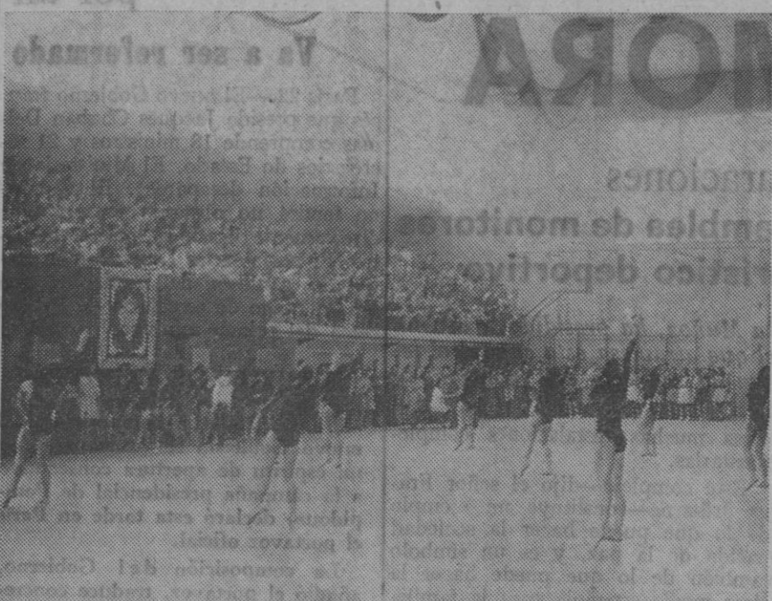
Las alumnas en un momento de la demostración en presencia de un gran número de espectadores.

En el pabellón deportivo tuvo lugar ayer mañana la demostración de gimnasia y ritmo que llevaron a cabo las alumnas de la Escuela Nacional de Educación Física «Ruiz de Alda», de Sección Femenina. Digamos ya que la exhibición alcanzó un gran éxito, rubricado por los prolongados aplausos del numeroso público que asistió a la misma.