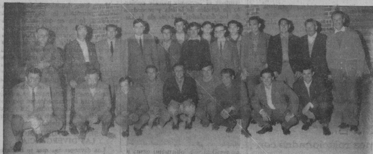
Alumnos asistentes, en Codorniz, en un curso impartido por la Gerencia del Patronato de Promoción Profesional Obrera, cuyo gerente posa en unión de los citados alumnos.