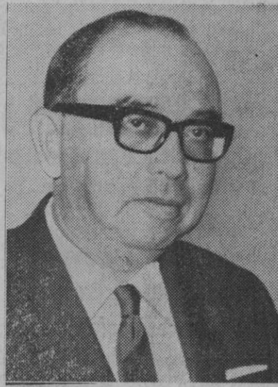
Thunku Abdul Razak, vicepresidente ministro y hombre fuerte de Malasia, que ha sido investido de plenos poderes para restablecer el orden en su país

Como ya se sabe, la encíclica « Humanae vitae », en la que se desautorizan