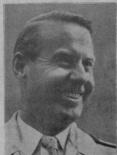
Thor Heyerdahl, explorador noruego, decidido a llevar a cabo su audaz travesía del Atlántico en una embarcación de papiros