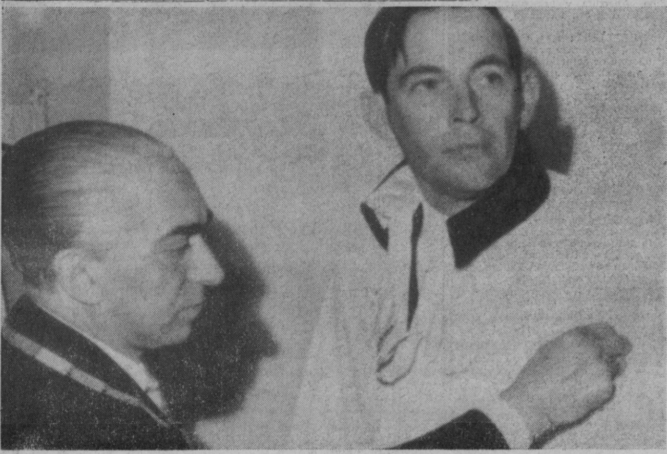
Palma de Mallorca.—Se entregó al doctor Barnard el símbolo del premio "Dag Hammarskjöld 1969", mientras Blauberg cumple sesenta años y se habla del divorcio del propio Barnard. En la foto, un momento del acto.

Que la señora Lollobrigida «no entra para nada» quedaba demostrado ayer en el mismo aeropuerto, puesto que mientras el médico aguardaba—defendiéndose como podía del asalto periodístico—el avión que había de llevarle a Nápoles, la famosa actriz esperaba en otro lugar del aeropuerto que un avión la trasladara a París. También negaba cualquier relación amorosa con Barnard. «No quiero hacer ningún comentario sobre su divorcio—decía Gina—y por mi parte sólo puedo decir que no tengo ninguna intención de volverme a casar».—(De «Ya»).