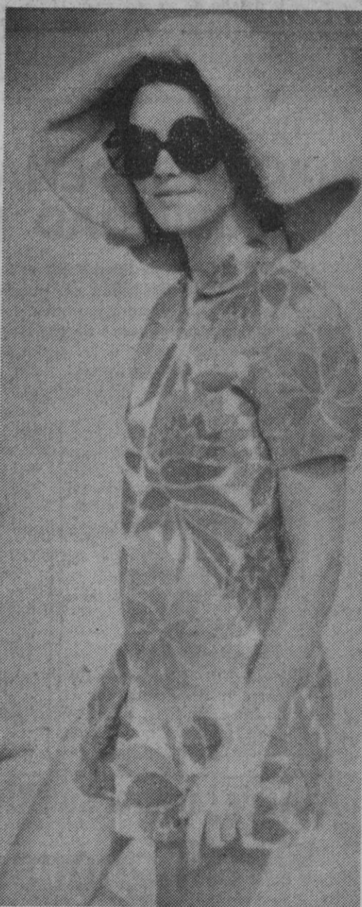
Vestido-pantalón en rizo de algodón estampado. Modelo Tweka (Holanda).