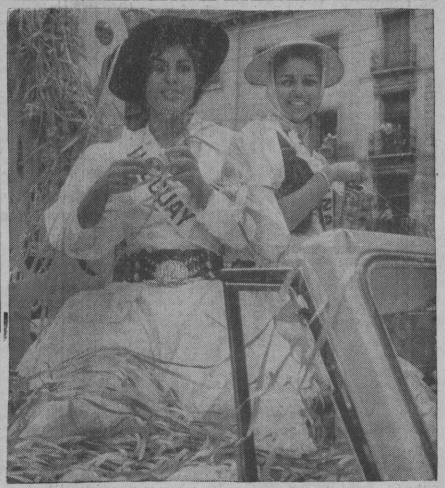
Zaragoza.—Con participación de las majas internacionales, que se encuentran en la ciudad, se celebra en Zaragoza las Fiestas del Coso Blanco.