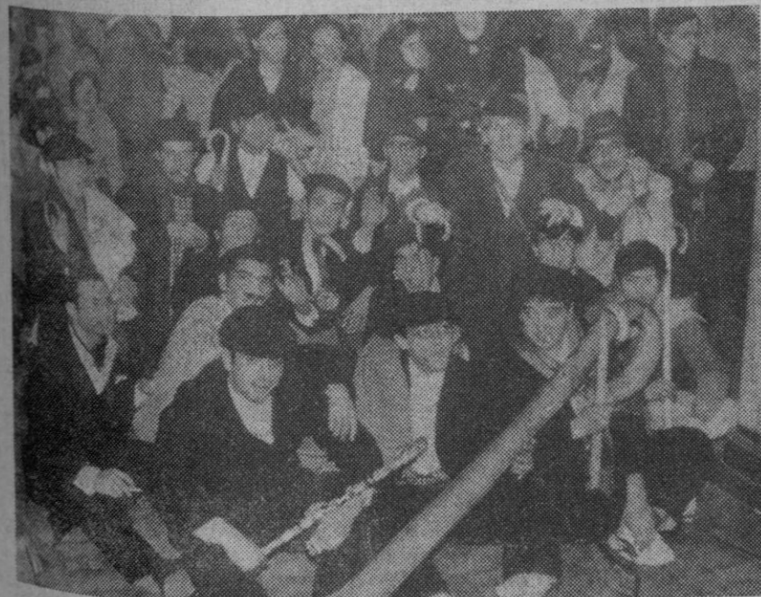
Se celebró ayer por la tarde la anunciada «Fiesta del Paleta», organizada por el Club Cultural «Studio». El éxito fue completo. El numeroso público asistente a la misma—con predominio de la gente joven—pasó unas horas muy agradables, en las que el buen humor fue la nota predominante. Muchos de los chicos y chicas se presentaron en la sala vestidos con arreglo a la «época». Aquí tenemos a un grupo de simpáticos «paletos», todos muy dueños del papel que «representaban».

La sesión última de la semana en Bolsa se cerró con casi iguales cambios que en la sesión anterior. Se operó con eficacia en acciones. En fondos públicos se notó una pequeña mejoría. En cupones flojearon los cambios.—Cifra.