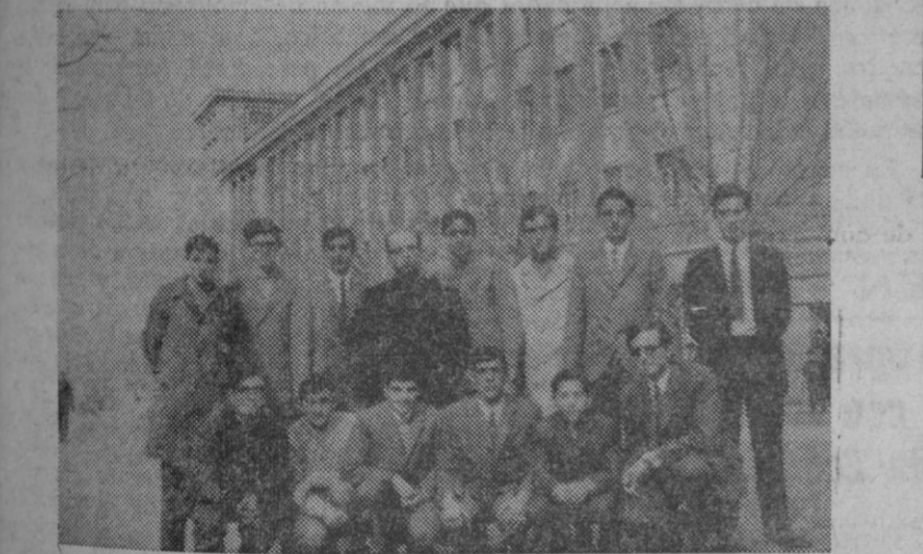
Informamos ya a los lectores de la intervención, mañana por la tarde, en el espacio de TVE "Cesta y puntos", de un equipo del colegio Claret, de los Padres Misioneros de nuestra ciudad.