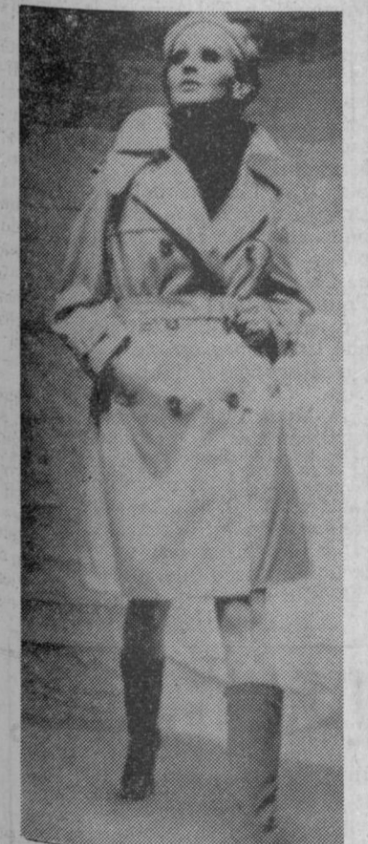
El estilo de "Bonnie and Clyde" en un impermeable de gruesa gabardina de algodón

Servicio nocturno (cuartelillo de la Policía Municipal)..... 1458