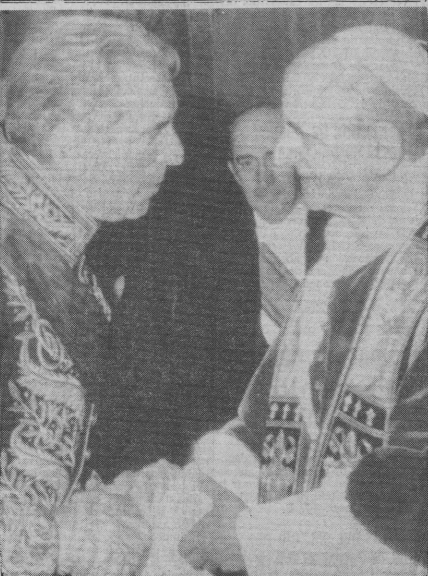
Ciudad del Vaticano.—El Papa, Pablo VI, saludando al embajador español ante la Santa Sede, don Antonio Garrigues y Diaz Cañabate, durante la audiencia de año nuevo, celebrada ayer.

Ciudad del Vaticano, 13.—Su Santidad el Papa, Pablo VI, ha recibido hoy, en audiencia privada, en el palacio apostólico, al general de la compañía de Jesús, padre Pedro Arrupe.—Efe.