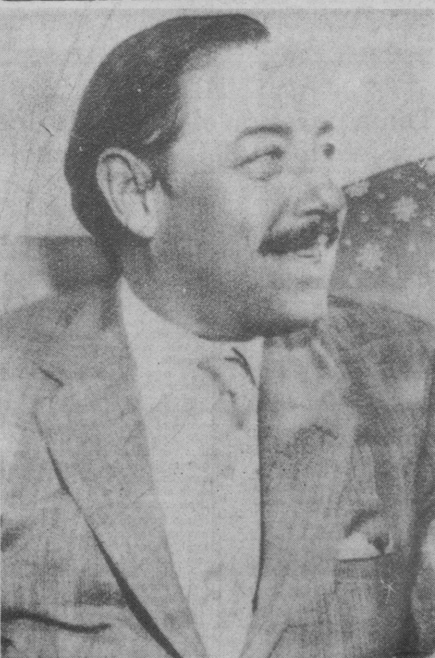
El autor teatral Tennessee Williams, que cuenta en la actualidad cincuenta y siete años de edad, conocido por sus obras de claro tono acre y fatalista, se ha convertido al catolicismo. Las palabras exactas del gran autor, a la pregunta de por qué esta decisión, fueron: "Quiero volver a Dios".