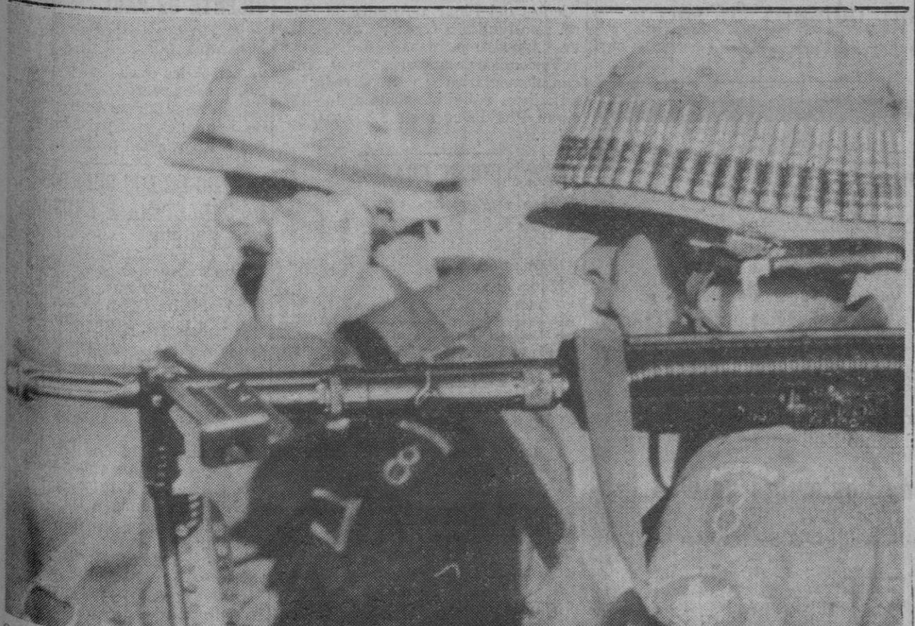
Casa de Juan Núñez (Albacete).—Con su ametralladora ligera M-60 al hombro y una cinta de balas alrededor del casco de acero, un soldado norteamericano se dirige a sus posiciones de «combate» en el segundo día de la «Operación Pathfinder Express». Mil hombres de un batallón aerotransportado norteamericano fueron traídos por vía aérea desde Alemania y se arrojaron en paracaídas para participar en las maniobras conjuntas hispano-norteamericanas.

«En Lemona —se añade— va a ser instalado junto al actual, un nuevo y moderno horno, capaz para producir por sí solo medio millón de toneladas anuales». —Cifra.