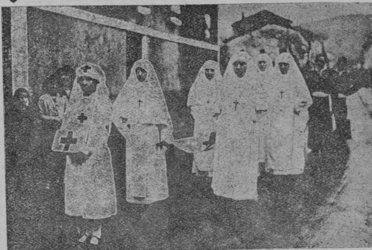
Interesante procesión misional celebrada hace unos días en Lasarte (Guipúzcoa)