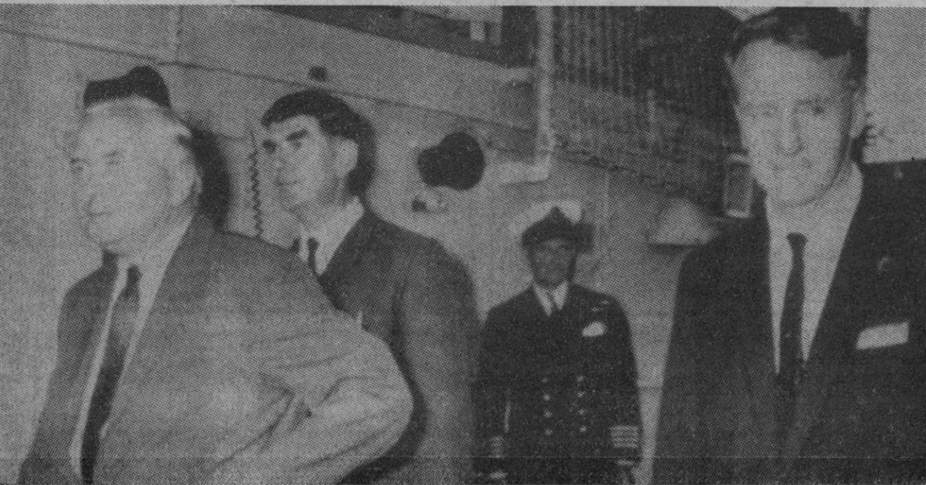
Gibraltar.—El primer ministro británico, Harold Wilson, con el "premier" rodesiano Ian Smith, a su llegada a bordo del barco inglés en que se están celebrando las conversaciones de Inglaterra y Rodesia, en aguas de Gibraltar.

De fuente bien informada se ha dicho que esta sesión extraordinaria celebrada en el navío británico "Fearless" ha sido, posiblemente, la más importante de los dos días de conversaciones.—Efe-Reuter.