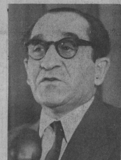
François Mitterrand, jefe del partido de izquierda unificada, y Mendes France, antiguo primer ministro, que destacan en su oposición al régimen del general De Gaulle