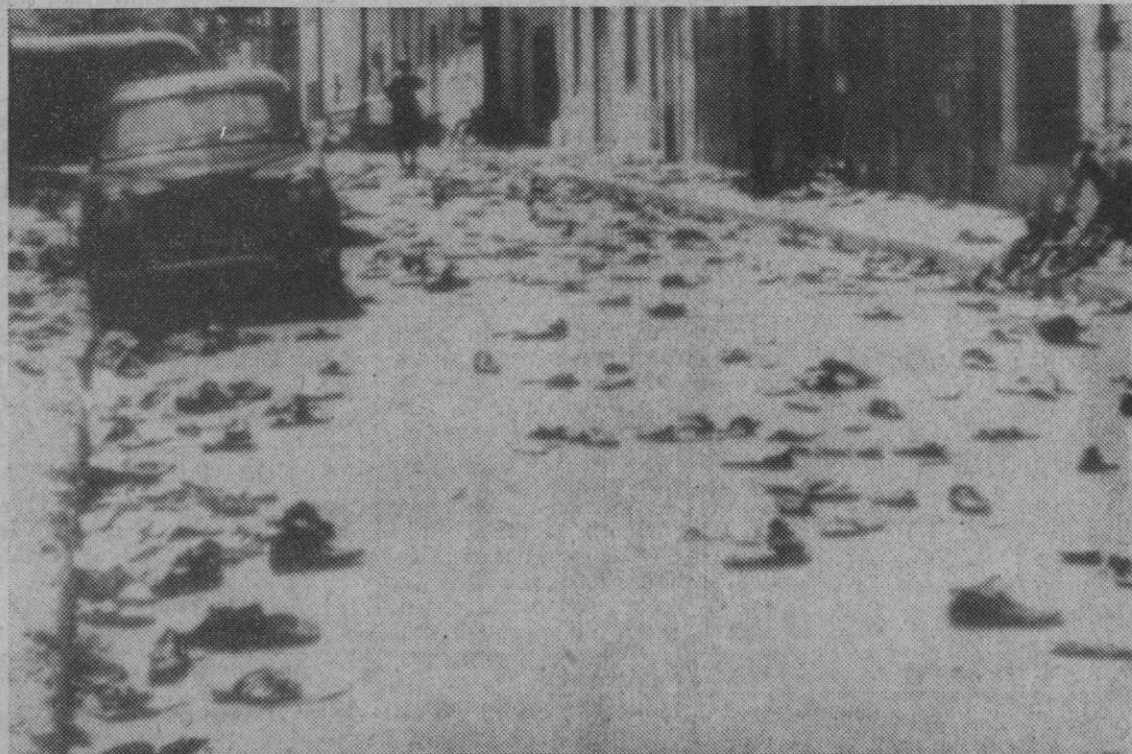
Dakar.—Aspecto de una de las calles principales de esta ciudad, que aparece materialmente cubierta de zapatos y sandalias de los miles de estudiantes y obreros que han tomado parte en una serie de manifestaciones violentas.—(Foto AP-Europa Press)

Colonia, 13.—El boxeador alemán Jupp Elze, que sufrió un colapso después de su pelea por el título europeo, frente a Juan Carlos Durán, y que fue urgentemente trasladado a un hospital al no recobrar el conocimiento, sigue en estado crítico y los doctores han manifestado que aún no se conocen las causas de su gravísima lesión.—Afil.