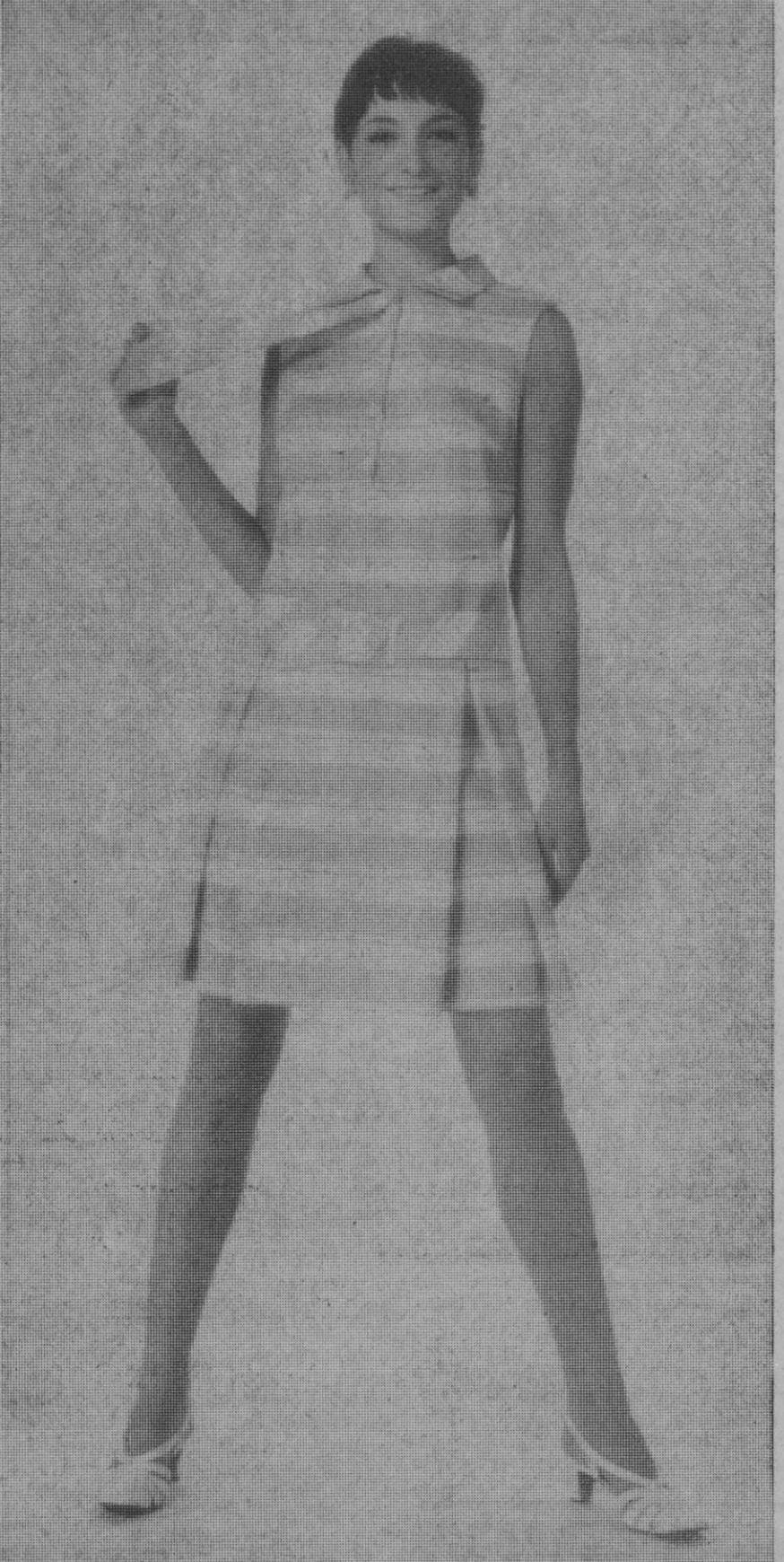
El verano después de esperarlo con ansiedad durante largos meses, tarda a veces en llegar. Pero de pronto, ya está aquí, y la tibieza de los rayos del sol nos obliga a despojarnos de toda clase de abrigo. Se busca la ligereza, la libertad, la frescura. Y dentro de todo ello, se busca sobre todo la belleza, que en verano se hace espléndida, joven, dinámica.

El traje es un pretexto más para aumentar el atractivo, y se busca la línea que conviene a cada una, el color que realza al máximo el de la piel, el de los ojos y el de los cabellos.