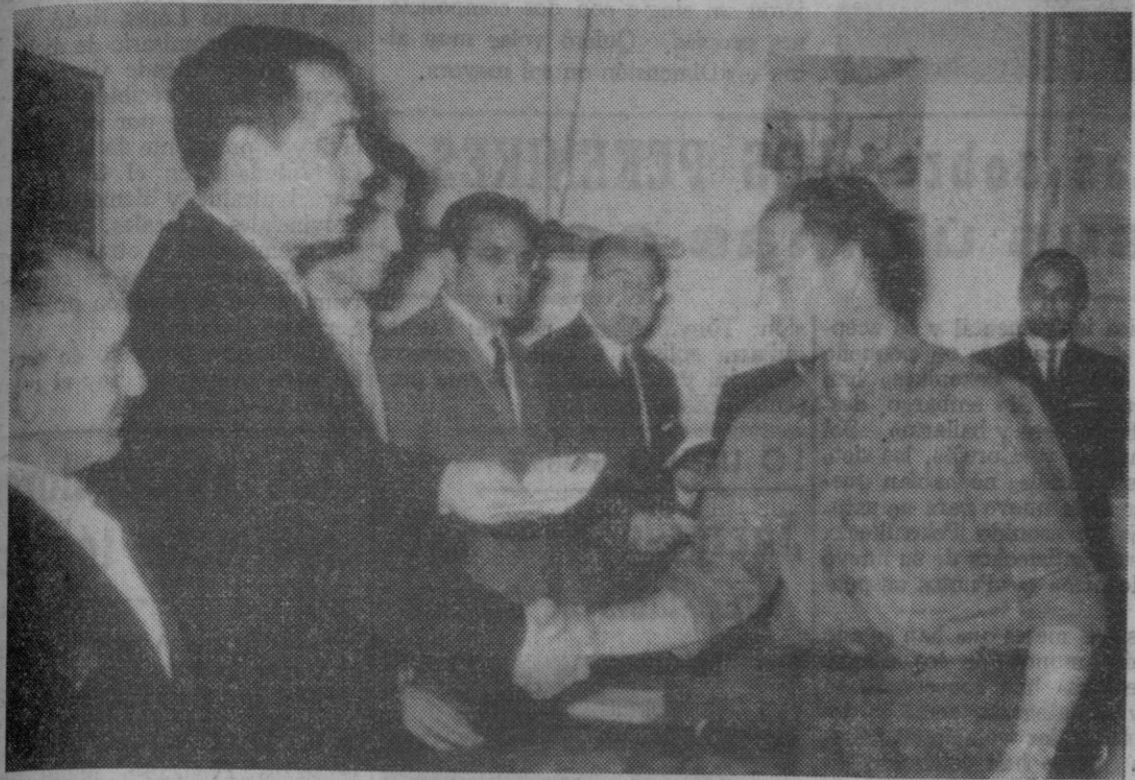
El delegado de Trabajo entrega el carnet a uno de los alumnos del curso.