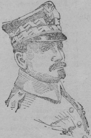
El ex presidente polaco mariscal Pilsudski, cuya figura ha vuelto a ponerse de relieve en la política extranjera.