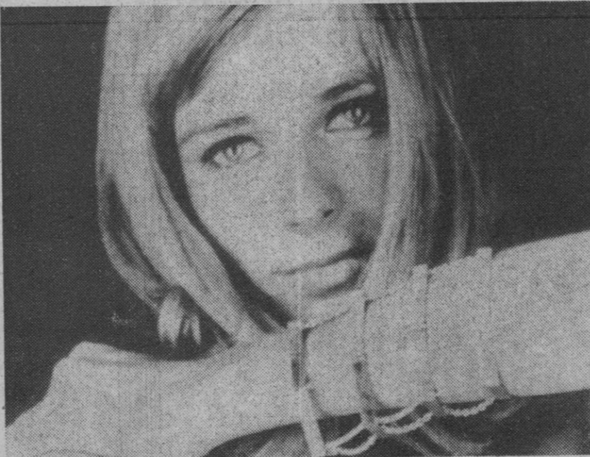
Cuatro aros unidos con cadenas. La chica parece querer decirnos irónicamente: Ya veis; esta pulsera parece una reja de esconde misterios.