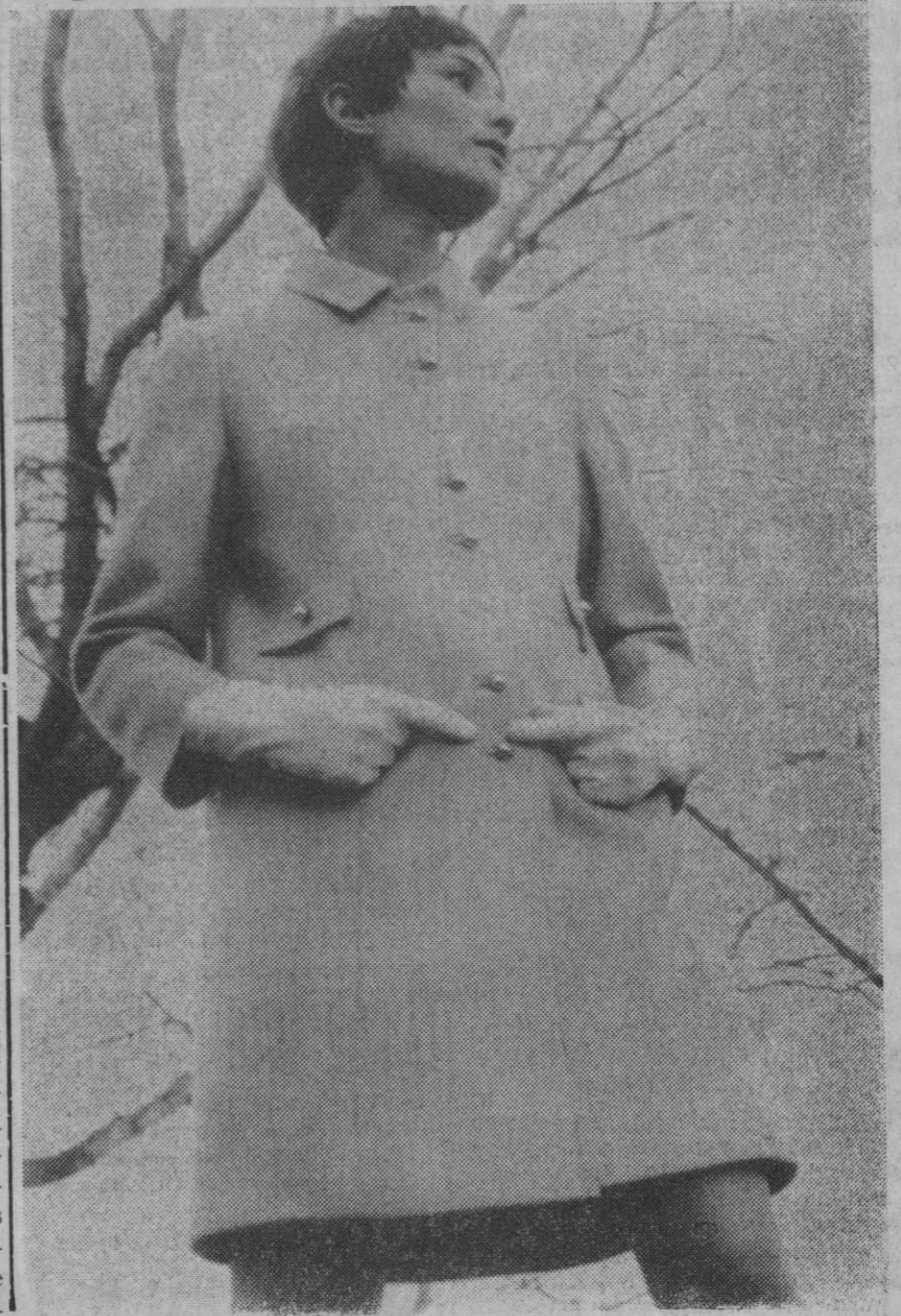
Es evidente que la primavera incita al color. Hay un suave despertar en la naturaleza donde las tonalidades se hacen tiernas y delicadas. La primavera es fundamentalmente dulce, grata, apacible.

Con ella, el guardarropa comienza a aclararse tímidamente. Los pesados abrigos oscuros se guardan y dejan paso a otros más ligeros, más claros, más alegres.