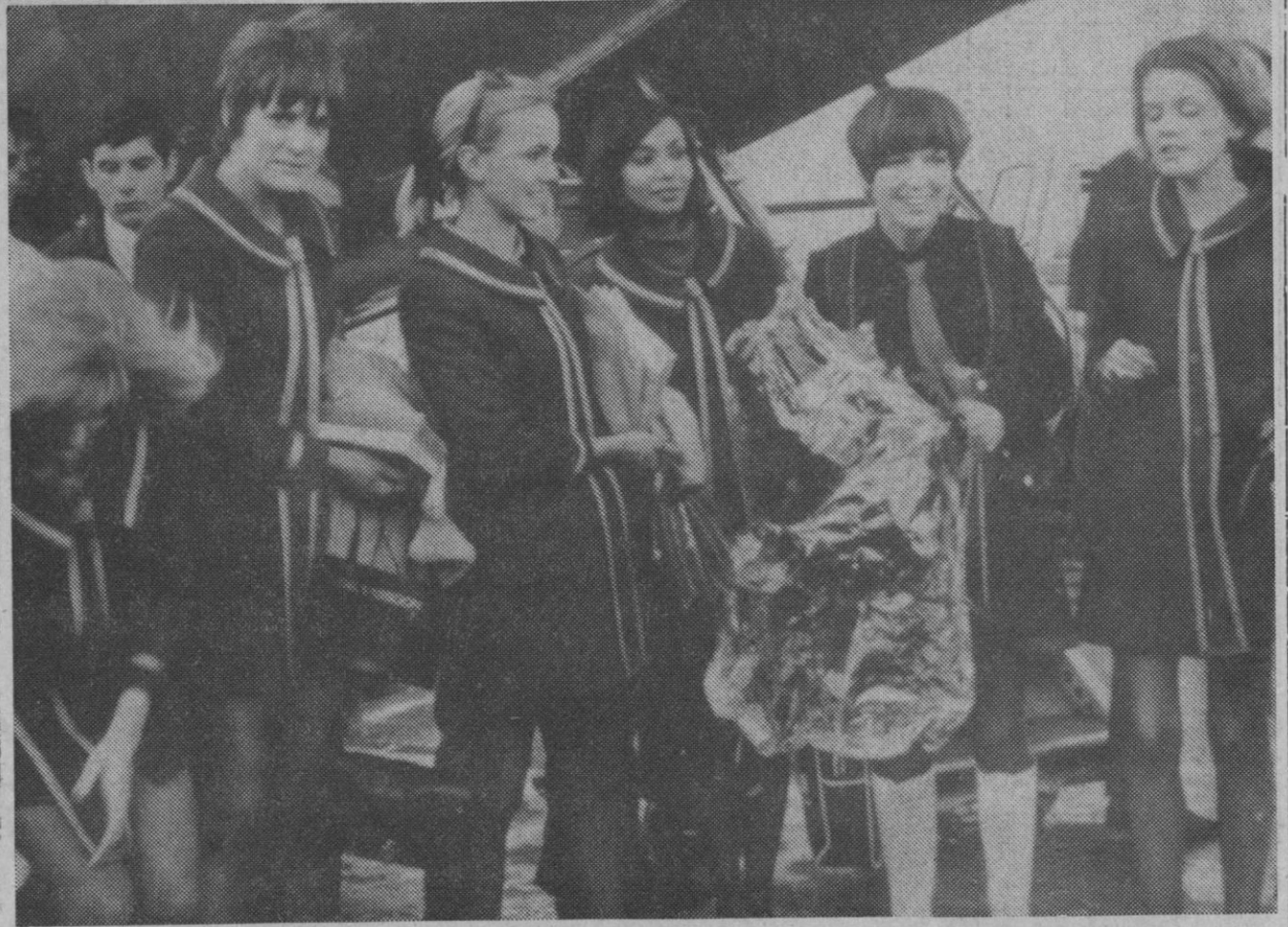
Madrid.—Mary Quant ha llegado a España. La acompañan cinco modelos, que lucen, ¿cómo no? minifalda. Vienen para un desfile que está patrocinado por la Embajada británica en Madrid.

El interés bancario crítico del 8 por ciento fue establecido el pasado 18 de noviembre como parte de las medidas que acompañaron a la devaluación de la libra esterlina de 2,80 a 2,40 dólares.—Efe-Upi.