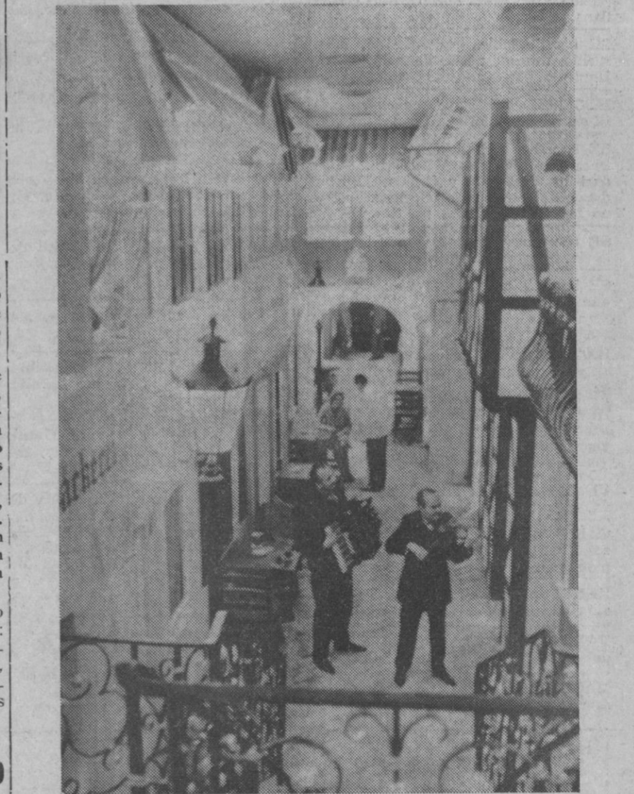
Düsseldorf.—Un ingenioso gastrónomo transformó una casa en una ciudad en miniatura de estilo típico. A ambos lados de la calleja se hallan macizas casas de entramado, cuyos muros tienen una edad de doscientos años. Faroles de gas alumbran el pequeño mercado y músicos callejeros o un viejo orquestrón procuran la debida atmósfera