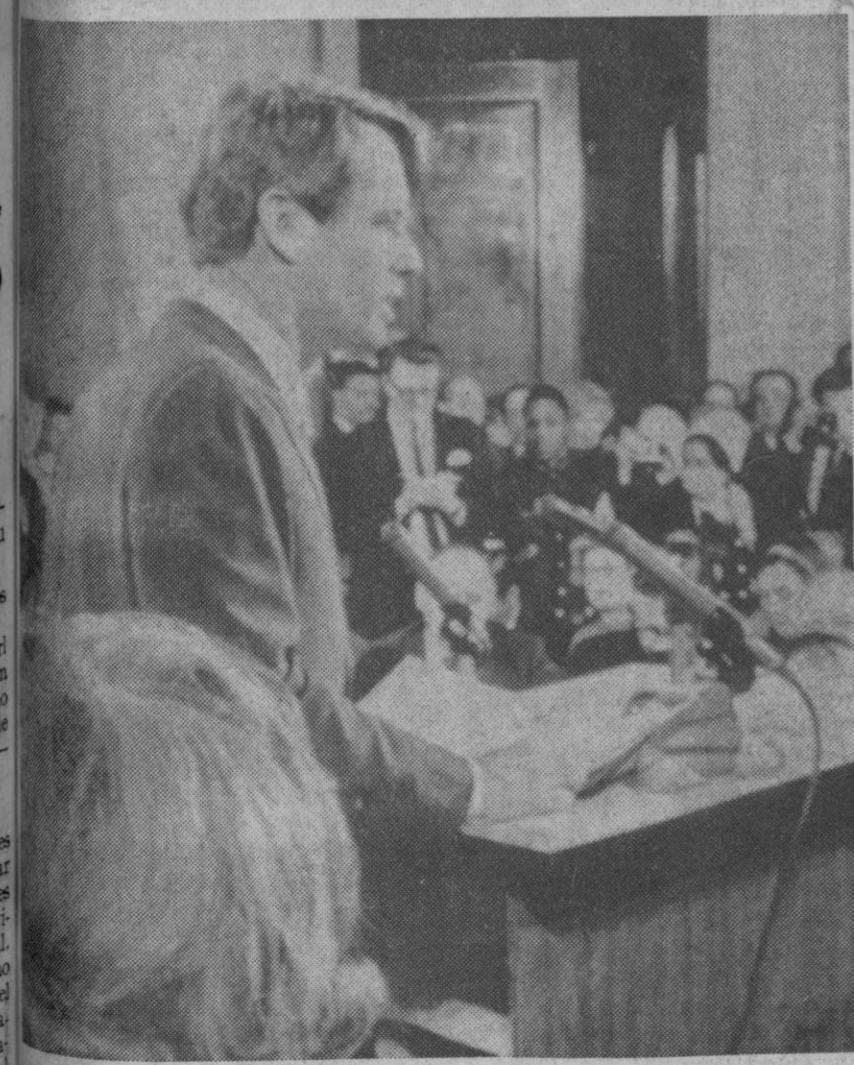
Washington.—El senador Robert F. Kennedy, en el momento de anunciar oficialmente la presentación de su candidatura con vistas a ser elegido por el partido demócrata candidato a la Presidencia.

Los últimos hallazgos de uranio, realizados por la Junta de Energía Nuclear, han tenido lugar en Leiza, Navarra, provincia en la que existen importantes yacimientos. España puede potencialmente convertirse en el primer país de Europa en cuanto a reservas de uranio se refiere. Francia, que ostenta actualmente el título, ha explorado su arena metropolitana, y sus reservas tienen carácter casi definitivo, lo que no puede afirmarse de España.—Cifra.