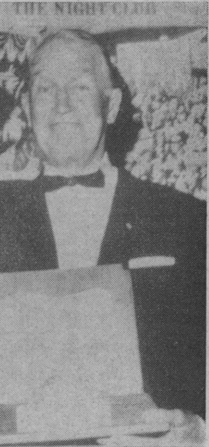
Octogenario y sonriente, el simpático Chevalier considera que ya debe retirarse de los escenarios.

Pareció adivinar mis pensamientos al decirme: —No tengo hijos a quienes hacer