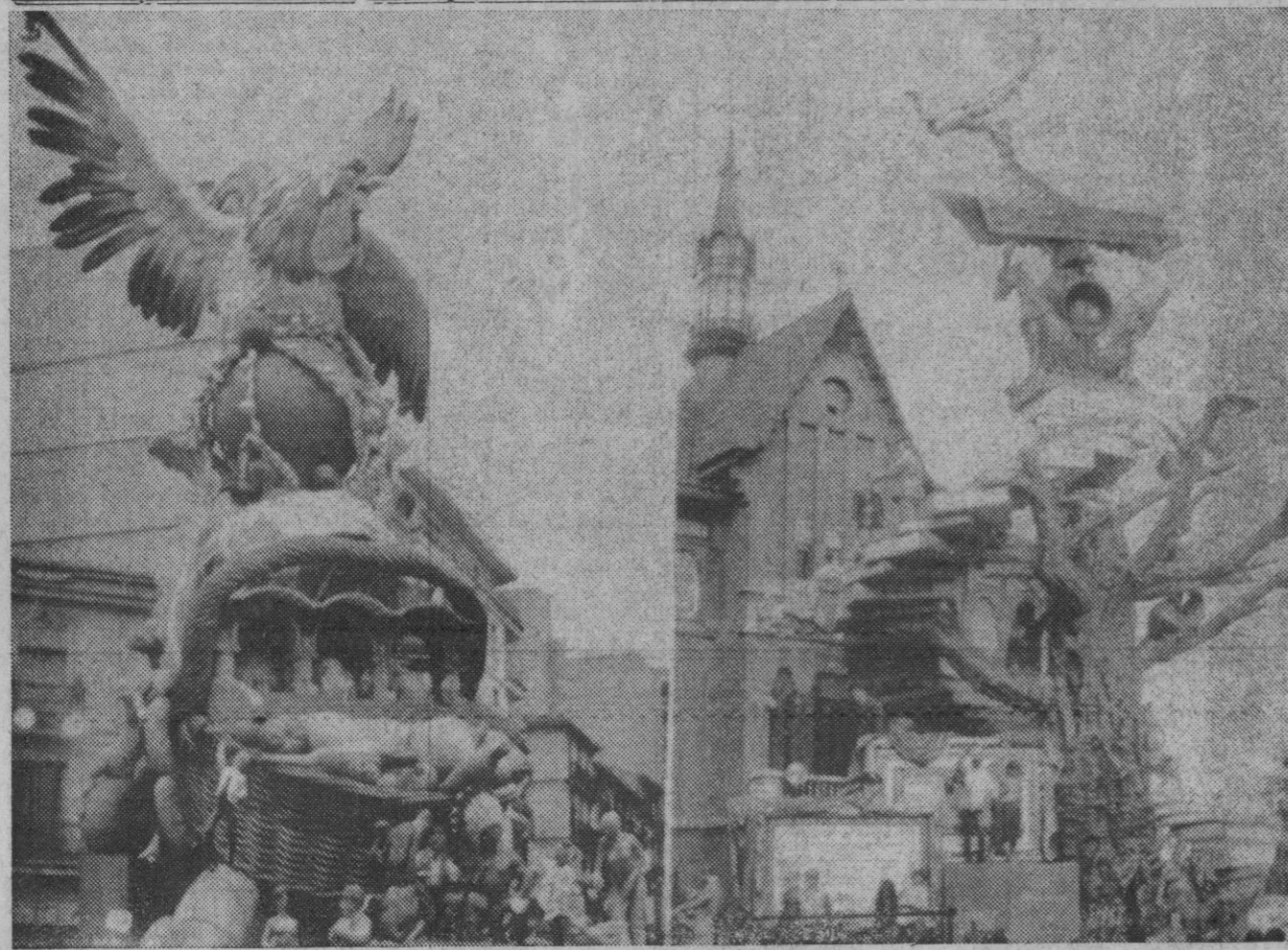
Valencia.—Dos de las más bellas fallas valencianas en espera de la famosa "cremá", que tiene lugar esta noche.

El párrafo último de este artículo es el siguiente: «Las sanciones que sean impuestas por faltas graves y muy graves, se podrán hacer públicas por la Delegación del Gobierno».