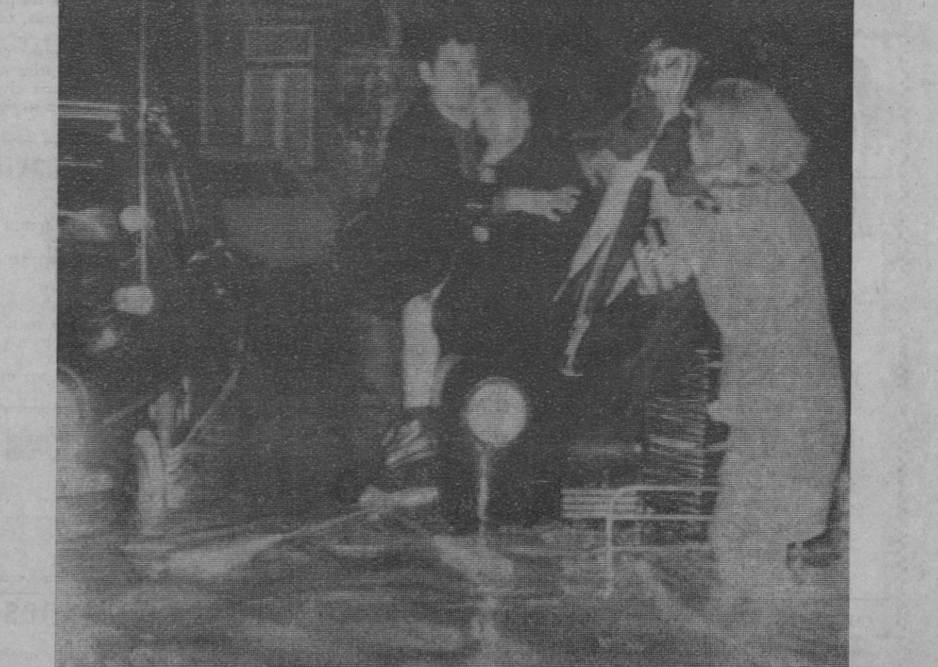
Lisboa.—Una mujer es socorrida por miembros de su propia familia que aparecen con el agua hasta las rodillas en una de las calles de la capital portuguesa, en la que se han producido graves inundaciones.

Londres, 27.—Los estibadores de los muelles londinenses han acordado hoy por votación poner término a la huelga de ocho semanas que había sido desautorizada y que retuvo por valor de más de 100 millones de libras esterlinas, exportaciones de carácter vital.—Efe-Reuters.