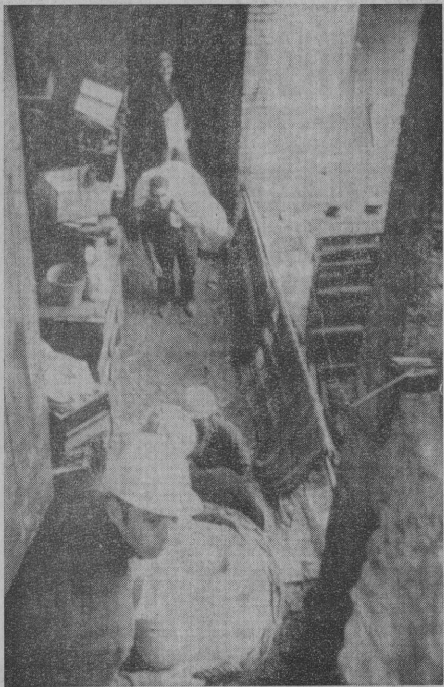
Fayton (Zaragoza).—Las intensas lluvias caídas durante los últimos días han hecho que se desbordaran las aguas contenidas en la presa que se construyó junto a este pueblo, por lo que su prevista evacuación a otro construido a tal efecto se ha llevado a cabo antes de la fecha fijada. Los vecinos toman consigo todos los enseres ante la llegada de las aguas.

tre otras cosas: —Retirar de la isla las tropas que Turquía considera «ilegales». —Indemnizar a la población de los dos pueblos turcos-chipriotas que fueron atacados la semana pasada por las fuerzas griegas, lo que dio lugar que se reanudara la crisis chipriota, que tiene ya seis años de duración. —Retirar el general George Grivas como jefe de la Guardia Nacional griega de la isla.—Efe-Upi.