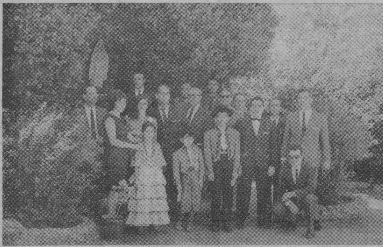
Momentos antes de servirse el desayuno extraordinario con que en la mañana de ayer se obsequió a los acogidos en la Residencia de Ancianos por parte del gremio de hostelería, el presidente del Montepío de Camareros, mandos del Sindicato de Hostelería, miembros de las cuadrillas de la bodega y otros invitados posan en el jardín de la Residencia, ante una estatua de la Virgen. De los actos celebrados con motivo de la festividad de Santa Marta, encontrará el lector detalles en nuestra información local.

Día 21: Elecciones en cada provincia de los consejeros nacionales del Movimiento en representación de las provincias.—Cifra.