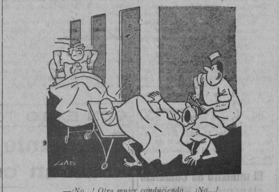
—¡No...! Otra mujer conduciendo... ¡No...!

Estufas AGNI 2.980 pts. al contado y regalamos seis cargas de gas calor gratis para todo el invierno CASA SOLERA