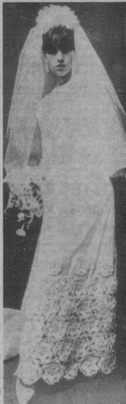
Tokio.—Modelo de traje de novia, de papel, de la colección que el modisto japonés Toyoko Hashimoto ha presentado en Tokio. El modelo, inspirado, según su creador, en la era espacial, cuesta sólo unas 2.500 pesetas.

Un buen marco realza un cuadro. No olvides que tus cabellos son el marco de tu rostro, y no deben desmerecerlo.