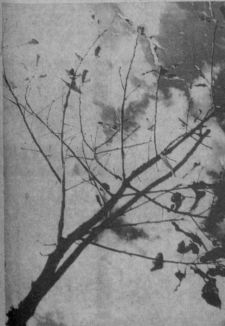
Roba (Cádiz).—Las casi desnudas ramas del árbol dan fe de que el otoño ha hecho su entrada oficial en España el día 21 de septiembre. Aunque este año el verano—que llegó tardío—se haya desquitado prolongando su vida oficial