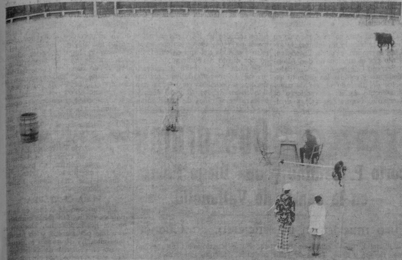
Los de la "buja", en el ruedo. Acaba de salir su becerro y ahí está la cuadrilla—incluido el mono, sobre la barra—esperando el momento de comenzar a hacer veir a grandes y chicos.

Carlos García, "El Huete", ganó el trofeo al mejor diestro