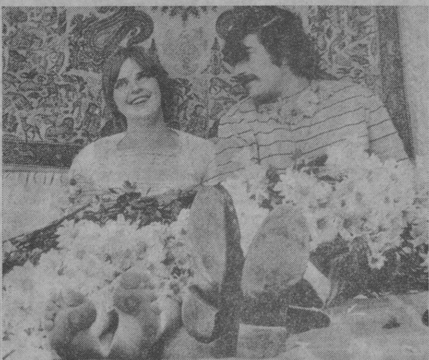
El nuevo matrimonio «hippie» en su hogar con las flores recibidas como regalo de boda.

Después de la ceremonia, más flores. Los amigos de los novios les acompañaron a su nuevo hogar cargados de margaritas.