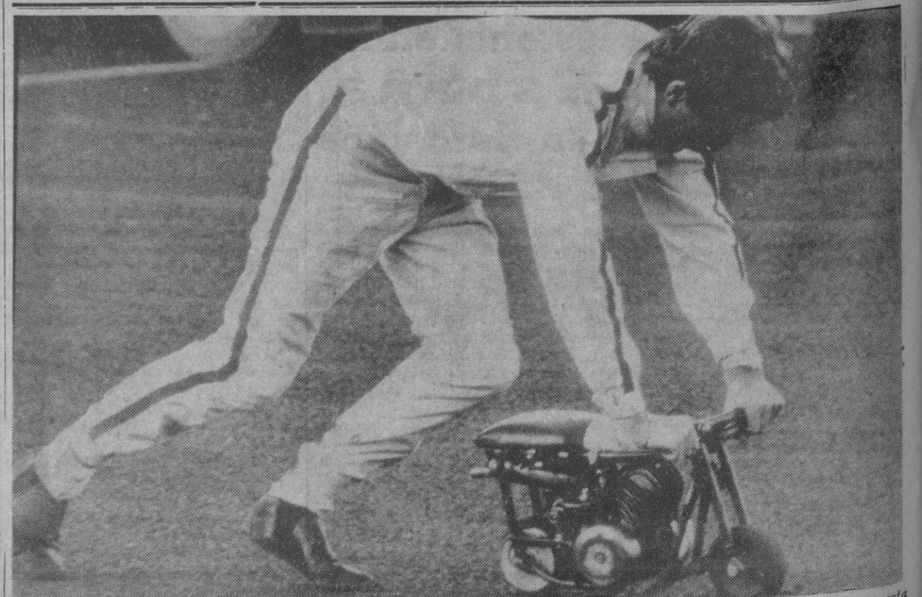
Helsinki.—El corredor de automóviles Jochen Rindt sorprendió a todos al utilizar para sus desplazamientos esta «mini-moto» cuando se disponía a participar en el Gran Premio de Helsinki. Rindt ganó la Fórmula 2, con un bólido, claro.

Osaka, 19.—El nuevo sistema automático para cortar el acero, por medio de un computador electrónico, ha sido adoptado por la constructora naval «Hitachi» en sus astilleros de esta localidad. Con el nuevo sistema obreros no especializados pueden conseguir la suficiente experiencia en la materia en sólo 10 días. Además, las horas de trabajo necesarias para cortar los materiales de acero se reducen a dos tercios en comparación con el tiempo empleado siguiendo el sistema convencional, siendo reducido asimismo, el margen de error de forma considerable.—Efe.