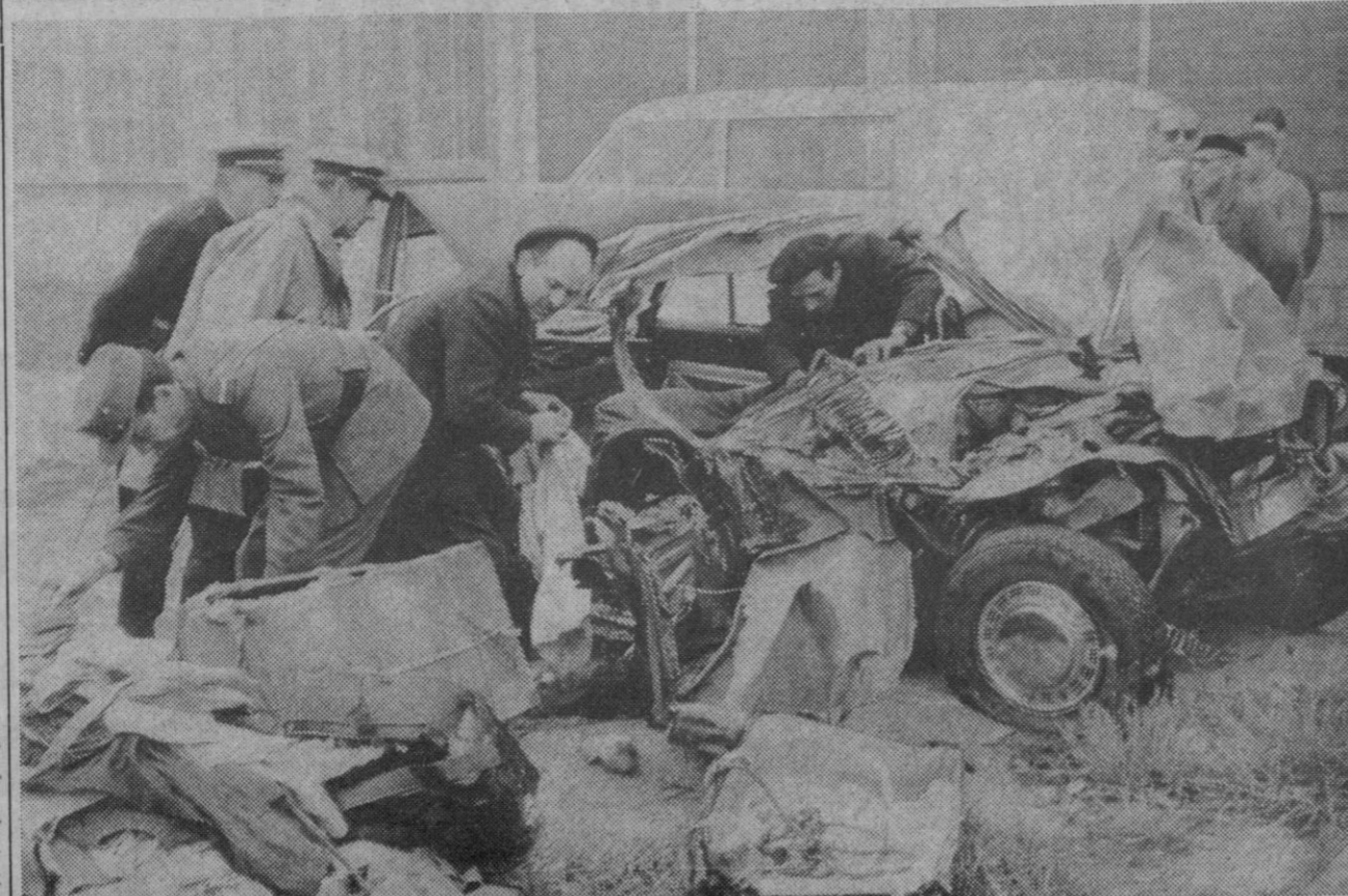
Victoria.—Los restos del automóvil portugués y de los equipajes del mismo. Iba ocupado por siete personas y se dirigía a la frontera hispano-francesa. Tres de ellos murieron en el acto. La cuarta víctima fue una niña de siete meses que falleció a poco de entrar en el centro de socorro. Se desconocen las causas de la terrible colisión del vehículo contra un camión matrícula de Bilbao que transportaba cemento.