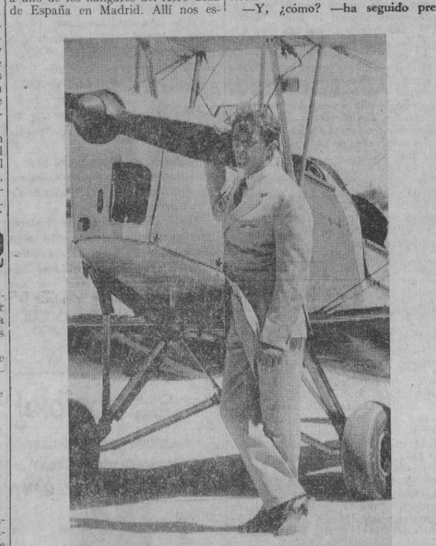
Robert Mitchum junto a la avioneta que aparecerá en la próxima película «Villa cabalgá».

Hora de las representaciones: diez de la noche.