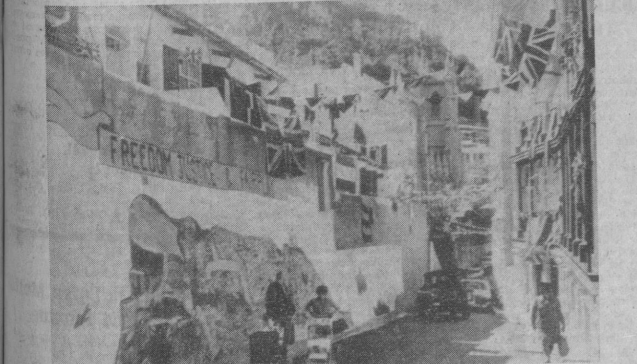
Gibraltar.—Una callejuela de Gibraltar cubierta de banderas de la «Unión Jack» y de carteles en inglés. El «referéndum», haciendo caso omiso de la decisión del Comité de Descolonización de la O. N. U., ha sido celebrado el pasado domingo, como es sabido.

«Mi afectuosa simpatía a Vuestra Santidad en vuestra penosa enfermedad y mis oraciones para su mejoría».—Efe.