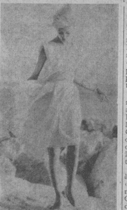
Alegre y juvenil vestido blanco, con aplicaciones de algodón bordado

Washington, 6.—El 88 por ciento de las personas que contestaron a una encuesta, desaprueba cómo se está dirigiendo la guerra del Vietnam, ha manifestado el representante Robert A. Taft Jr., republicano por Ohio. El representante Taft declaró que dicha encuesta fue realizada en su distrito y que, según él, el resultado de la misma Embajada reflejaba el pensamiento de una gran mayoría de norteamericanos.—Efe.