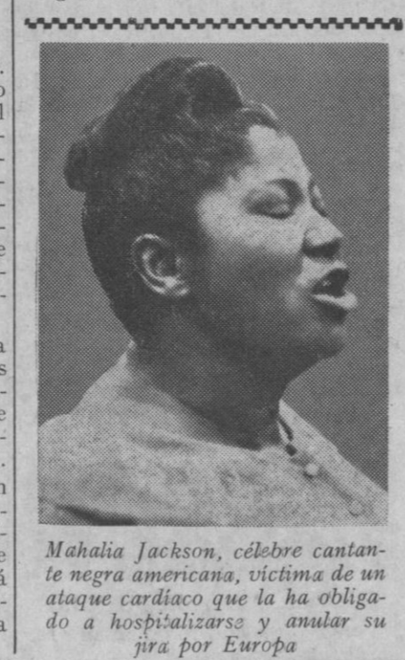
Mahalia Jackson, célebre cantante negra americana, víctima de un ataque cardíaco que la ha obligado a hospitalizarse y anular su gira por Europa

De esta manera y de acuerdo con la dirección trazada por las Naciones Unidas, el Gobierno español y el de la Guinea Ecuatorial se esfuerzan en sentar las condiciones para que el territorio pueda hacer frente, sin riesgos, a su futuro.—Efe.