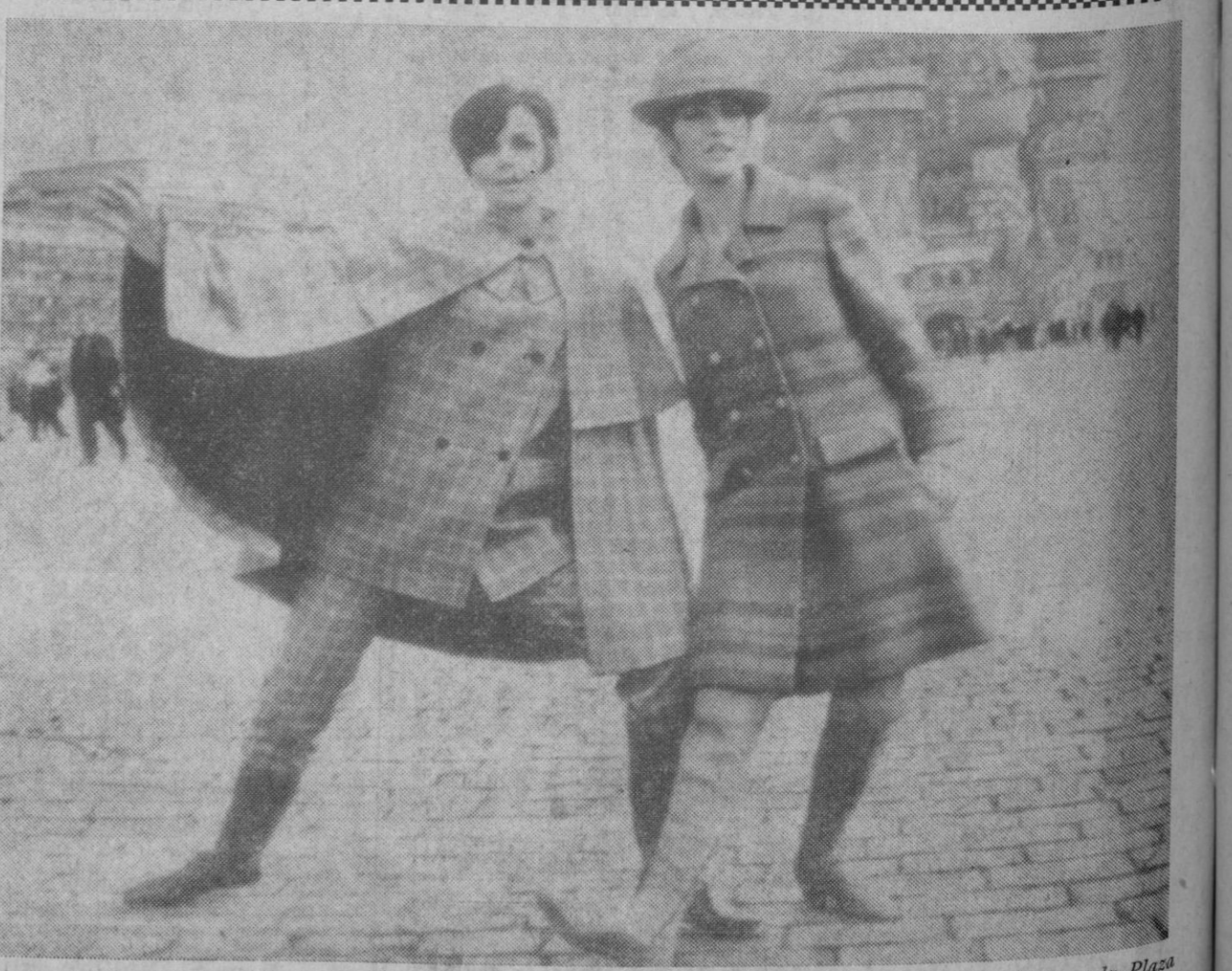
Moscú.—Dos modelos participantes en el Festival Internacional de la Moda, muestran sus vestidos en la Plaza Roja de Moscú. El modelo de la izquierda está diseñado por Reldan; el de la derecha, por Cojan.