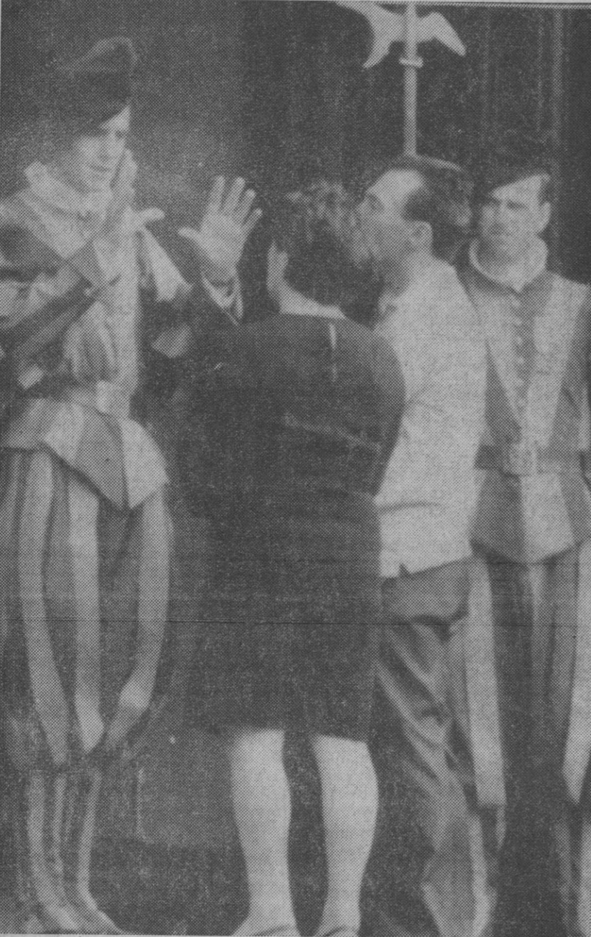
Castelgandolfo.—Los turistas preguntan a los miembros de la Guardia Suiza noticias sobre la salud del Pontífice, en la puerta de la residencia de verano de Castelgandolfo. El Papa ha suspendido las audiencias de esta semana por una indisposición causada por un resfriado.

«Queridos niños y niñas españoles y de otros países que integráis la «Operación Plus Ultra»: En estos momentos tenéis que encontraros en Castelgandolfo, porque el Santo Padre os esperaba. Una ligera indisposición de su salud, como bien sabéis, ha impedido esta visita que hubiera sido de tanto consuelo para el Papa».—Efe.