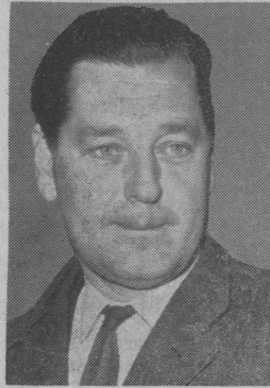
Anthony Crosland, nuevo ministro británico de Comercio en el Gobierno reorganizado recientemente por Wilson

Madrid, 6.—Ha sido clausurado esta mañana el XII Congreso Internacional del Frío. El acto se celebró en el gran salón de sesiones de la Casa Sindical y fue presidido por el ministro secretario general del Movimiento y delegado nacional de Sindicatos, don José Solís Ruiz.—Cifra.