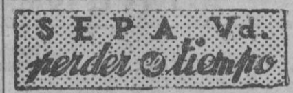
CRUCIGRAMA NUMERO 4.131

Por otra parte, todas las naciones del occidente europeo cuentan con un Ministerio de Sanidad y disponen del mismo el 85 por 100 de los países miembros de la Organización Mundial de la Salud (O. M. S.). España tuvo este Ministerio durante los años 1936-1939. Dada la amplitud de sus funciones, debería adoptar una denominación que abarcara sus tres objetivos fundamentales, prevención, sanidad y asistencia.—(De «Ya».)