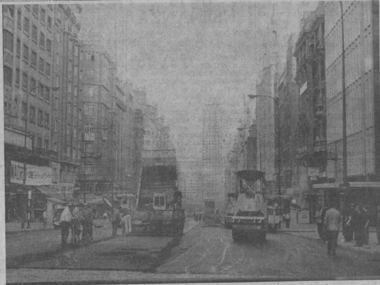
Madrid.—Un poco más abajo de la plaza de Callao, se provee de asfalto a la más moderna maquinaria, poco Madrid que más tráfico soporta. Comenzada durante la noche y utilizando la más moderna maquinaria, al amanecer de amanecer la operación había finalizado.

Sin embargo, se estima en medios diplomáticos de Londres que Gran Bretaña no se ha vuelto atrás de su conocida posición de que la soberanía sobre las islas está fuera de discusión.