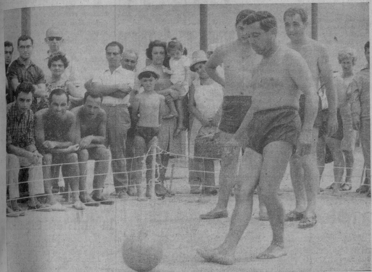
Tres entusiastas del nuevo deporte practican el mismo mientras que numeroso público parece interesarse por las jugadas.

de cuatro metros por ocho o cinco por diez, enmarcada con una malla fuertemente tensada, a base de goma. Naturalmente existe una señalización para hacer los saques normales y sancionar las infracciones que se produzcan según las reglas del juego. Se juega, como le digo, buscando la carambola y no a un número determinado como en el billar, sino basándose en el cronómetro, igual que en el fútbol se busca el gol. Yo creo que es un deporte mucho más difícil que el billar y que el mismo fútbol.