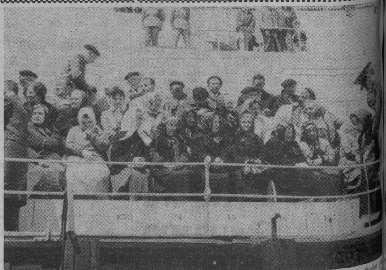
Madrid.—Un grupo de ancianos de Oviedo llegados especialmente para visitar Madrid invitados a las fiestas patronales, contemplan la novillada extraordinaria celebrada en el caso de las Ventas mientras una anciana del grupo es ayudada por un policía armada a colocarse en su localidad.

El capitán Kuzmenko añadió que el folklore español era muy estimado en la Unión Soviética, donde un artista llamado Lazarenko, graba exclusivamente discos con canciones españolas cantadas en castellano, logrando con ellos un gran éxito.