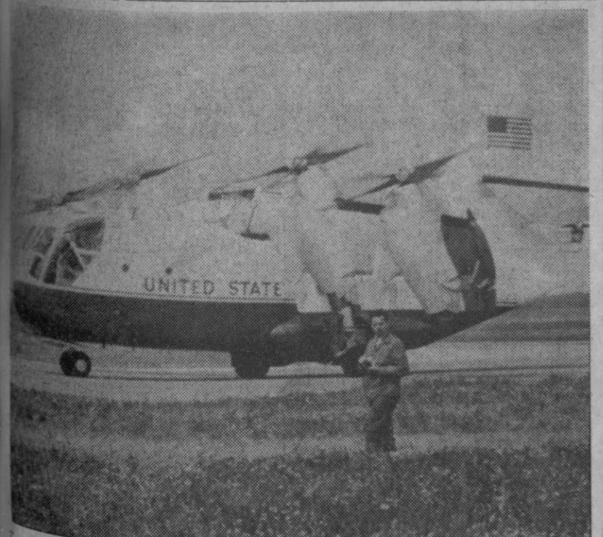
Corrección de Ardoz.—En la base de utilización conjunta hispano-norteamericana se hace la demostración de un avión de despegue y aterrizaje horizontal y vertical. XC-142a V/STOL. Inmediatamente después de tomar tierra coloca los motores en posición horizontal. Al poder volar con los motores en horizontal y aterrizar y despegar en ambas posiciones es propia para cualquier tipo de situación.