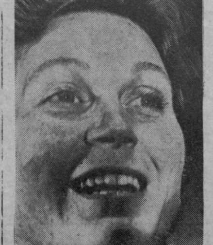
Svetlana Stalin, emigrada ahora en EE. UU., donde se la ofrece una enorme suma por su primer libro

EL EJERCITO DE KUWAIT A DISPOSICION DEL MANDO UNIFICADO ARABE Beirut, 18.—La embajada de Kuwait en la capital libanesa ha anunciado hoy que Kuwait había decidido poner su ejército a disposición del mando árabe unificado.—Efe.